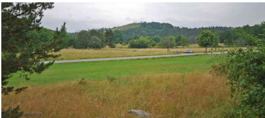
Sundby gårdstomt, vy mot söder. (Raä Lidingö 36:1)

Rudboda gårds skriftliga omnämnande 1381 är kopplat till ett köpebrev. Gården kan mycket väl ha kvar ett medeltida gårdsläge, beläget på en förhöjning ovanför viken, vars vatten då gick högre upp än i dag. Nuvarande gårdsmiljö som byggdes upp av grosshandlare Lemke i tidigt 1800-tal är en av de bäst bevarade äldre gårdsanläggningarna på Lidingö.