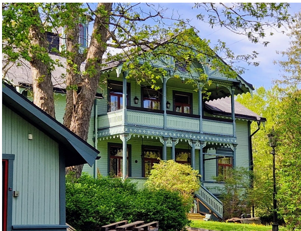
Finedal 1. Villa Finedal från 1886 är en av skärgårdens välbevarade sommarvillor och skyddas som byggnadsminne enligt Kulturmiljölagen.

En mycket genuin och särpräglad kulturmiljö är den före detta sommarvillan Villa Finedal (Finedal 1) samt den anslutande Fyrverkerifabriken (Lidingö 9:56) vid Stockbysjön. Båda är skapade av artillerifyrverkaren A.R. Törner på 1880-talet. Byggnadsminnet Villa Finedal från 1886 är utförd i en tidstypisk panelarkitektur som är mycket välbevarad.