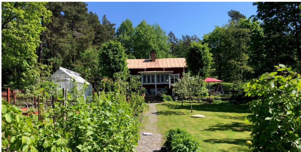
Marielund är en välbevarad mindre sommarvilla i Trasthagen.

klippstränder och små berghällar. Den största gruppen villor är själva Trasthagen som ligger på nordostsidan av Kottlasjön. En liten grupp villor ligger för sig lite mer mot norr, kring Pennaflod vid Stockbysjön, närmare själva Stockby. En större skogsdunge avgränsar de två husgrupperna.