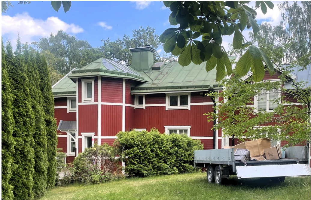
F.d. sommarvilla Fridhem 1.