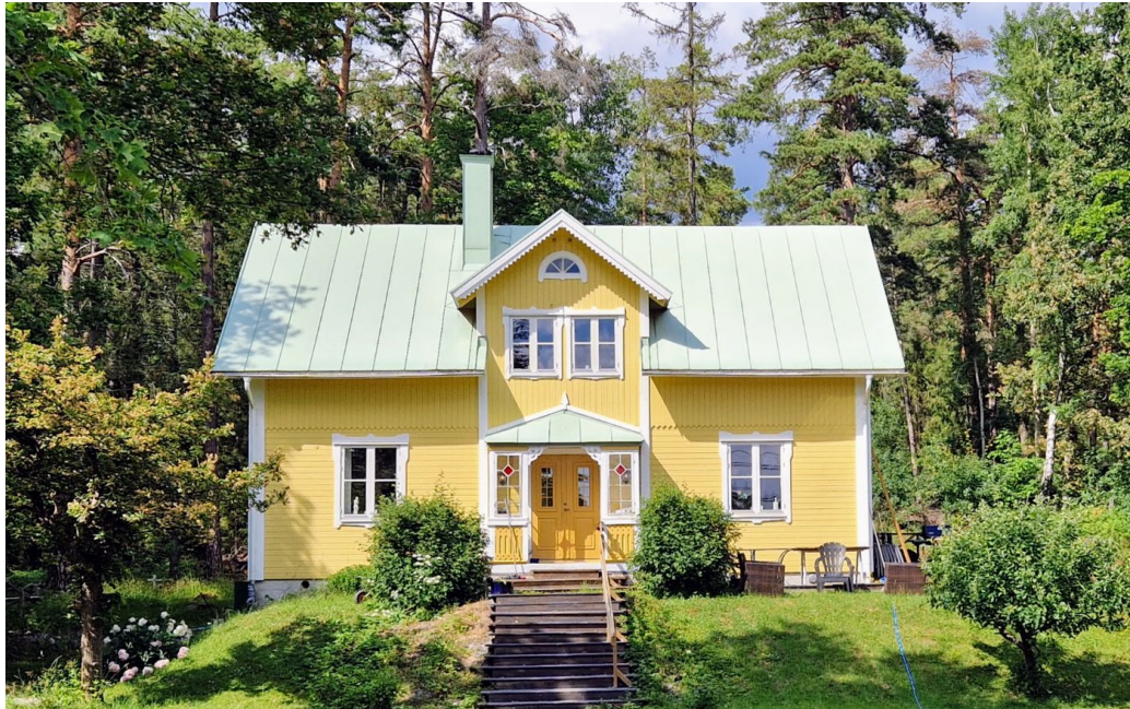
F.d. sommarvilla Lidingö 9:109.