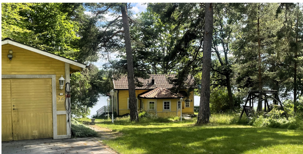
F.d. sommarvilla Egilsborg 1.

Bebyggelsemönstret är ganska regelbundet med villor placerade längs en rad med luftiga tomter. Norr och öster om den grusade landsvägen ligger villorna i indraget läge från vägen, placerade upp mot skogskanten och mot söder och sydväst vetter villorna mot sjökanten. Gemensamt för bebyggelsemönstret är bland annat det indragna, regelbundna läget och att villorna är orienterade mellan väg och skogskant samt mellan väg och sjö. Vidare har flera villor kvar äldre uthus, ofta utformade i stora drag efter villans exteriör.