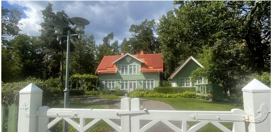
F.d. sommarvilla Lidingö 9:110.