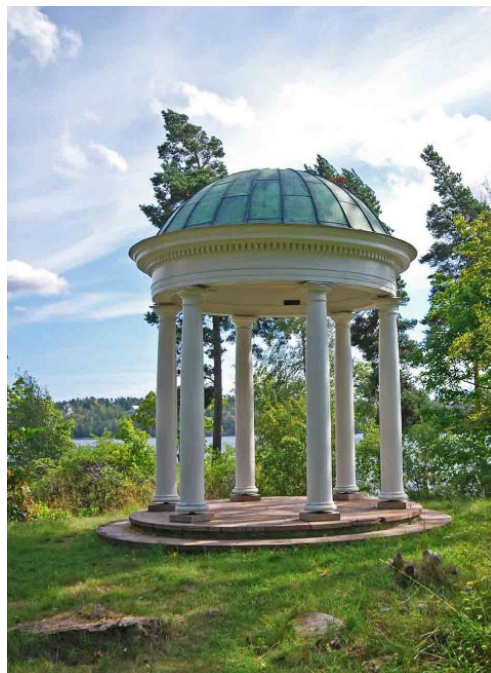
Ekotemplet från ca 1900 står längst ut på den natursköna Elfviks udde.

från 1817, som uppförts av den tidigare ägaren Lars Fresk till minne av kronprinsen den blivande Carl XIV Johan som besökte platsen detta år. Det klassicistiska lilla rundtemplet med vita kolonner och tandsnitt har i allt väsentligt sitt ursprungliga utseende i behåll.