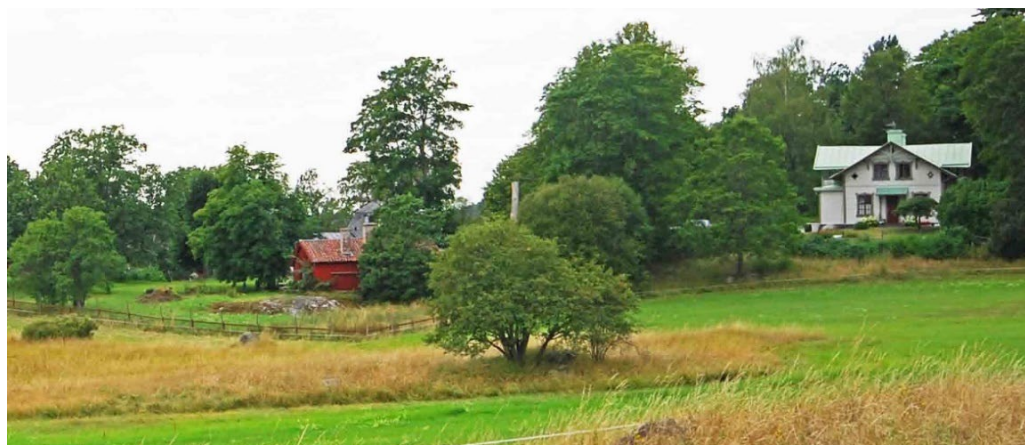
Långnäs gård, vy från Elfviksvägen mot det småskaliga kulturlandskapet samt det låga faluröda 1700-talshuset och den välbevarade sommarvillan från 1865.

I sydost på Elfviklandet anlades i slutet av 1800-talet flera sommarvillor på Elfviks gårdsägor mot Höggarnsfjärden. Fiskarudden, Hagen, Solhem och Östervik är namn på några av dem. Till villorna hörde ofta en trädgård inklusive odlingar av frukt, bär och rotfrukter. Höns hus, båthus, badhus, stallar, vagnslider etc. var nyttobyggnader som hörde samman med sommarlivet. Några villor revs längre fram under 1900-talet och de återstående villorna är i dag nästan alla ombyggda till åretruntbostäder.