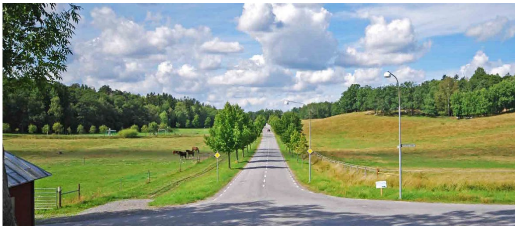
Elfviks gård, vy från gårdsentrén västerut längs Elfviksvägen med dess lindallé och omgivande småskaliga kulturlandskap som fortfarande bär drag av 1700-tal.

andelen åker mindre. Betesmark och ängsmark samt den betade skogen tog betydligt större utrymme. När herrgården utvecklades på 1770-talet omvandlades kulturlandskapet till ett öppnare och mer parkliknande odlingslandskap med nyröjda öppna åkrar, ängspartier, hägnade beteshagar och med mindre arealer betad skog än tidigare. 1800-talet innebar nyodlingsperioder på bekostnad av den gamla utmarken. Fortfarande vilar dock flera drag av det sena 1700-talets parkartade kulturlandskap över Elfviks domäner.