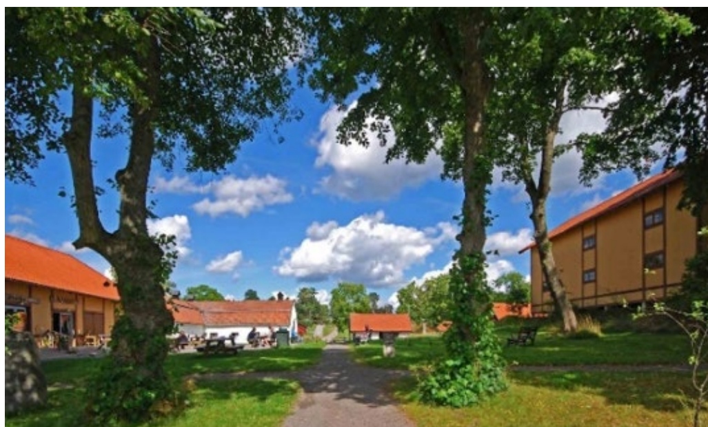
Elfviks gård med vy från mangårdsbyggnaden och de högvuxna vårdträden ut mot de gula 1870-talsflyglarna.

Parkrestaureringen på 1980-talet omfattade bland annat renovering av den även nu befintliga övre stenterrassen. Den tidigare regelbundna kvartersindelningen från 1700-talet ersattes av en stor gräsrunnel med omgivande planteringar och grupper av träd. Barrträdsparter tillkom och sannolikt även gångvägssystemet. 1980-talets restaurering bevarar flera av inslagen från 1890-talets parkanläggning. Framför allt betonades dock karaktären av det sena 1700-talets landskapspark med terrasser, samspelet mellan lövträdsgrupper och gräsytor samt den öppna vyn ner över sluttningen mot vattnet.