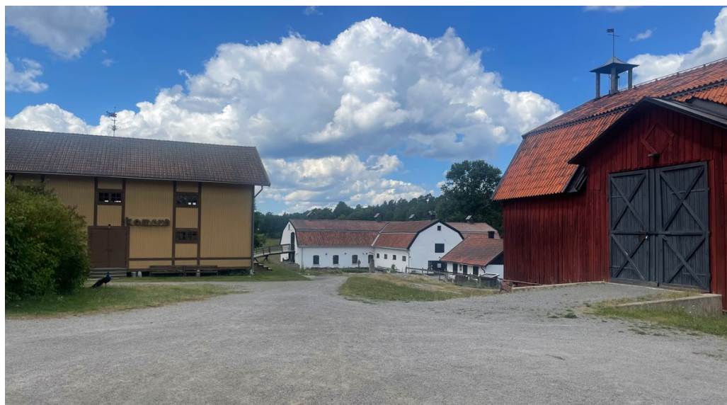
Den välbevarade ekonomigården med bland annat det gamla stallet från 1802.