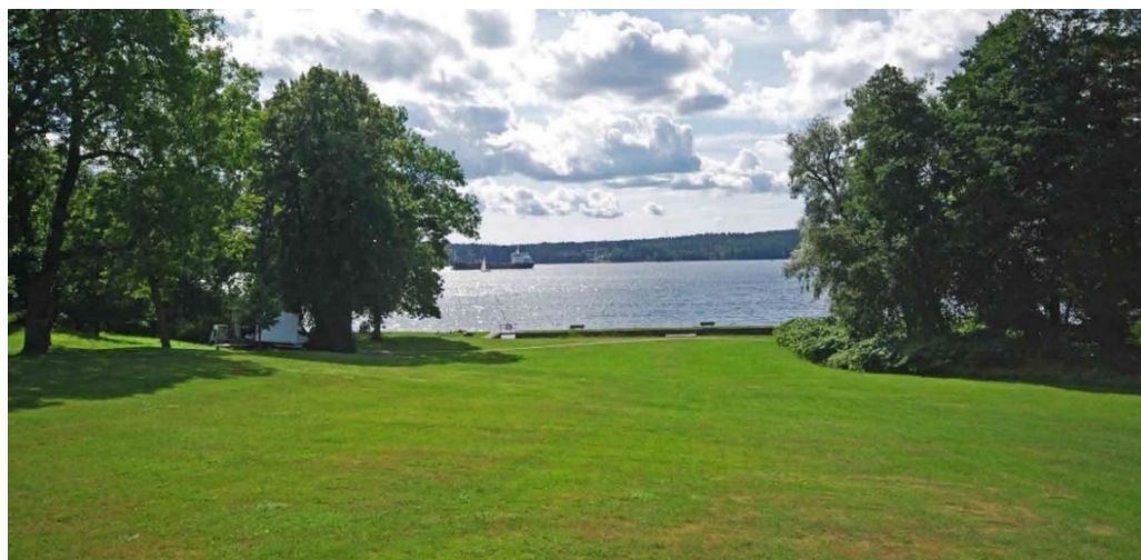
Sluttningsens pelouse (stor landskapsinfattad gräsmatta).

I parken ligger också den välbevarade rättarbostaden från 1890-talet och en tidstypisk sommarvilla i riklig panelarkitektur, "Gamla villan", från 1880-talet. Nere vid stranden står gårdens faluröda båthus och bykstuga från 1800-talet, mycket värdefulla små byggnader i all sin enkelhet.