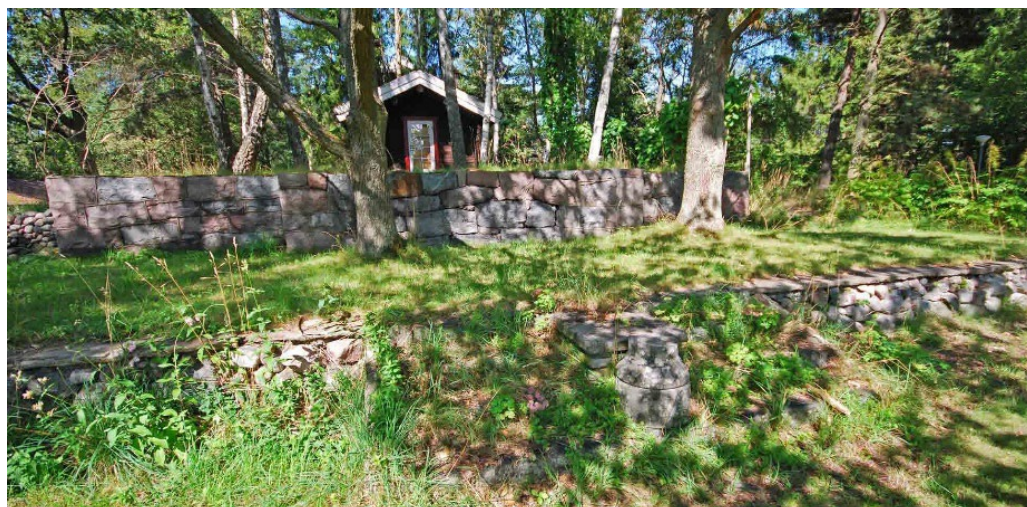
Den stora husgrunden till sommarvillan Villa Metsola från 1893 finns kvar, en mäktig stenmur med terrasseringar.