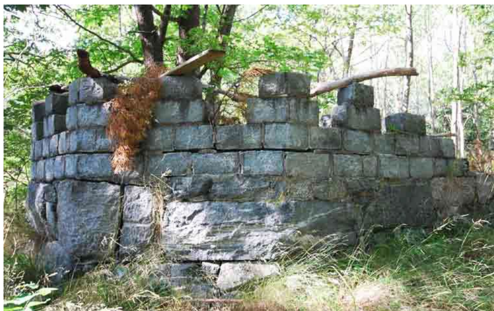
Inom tomten ligger några landskapsattribut, i form av romantiserande "tornruiner", kvar från den engelska landskapspark som omgav sommarvillan.