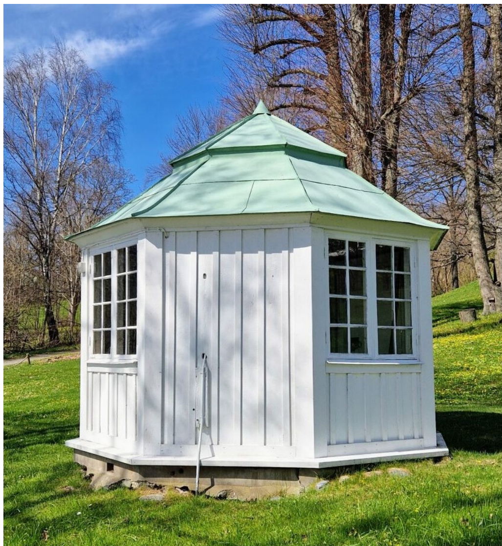
Den strandnära paviljongen i ljusmålad enklare panelarkitektur.

Av stort kulturhistoriskt värde är gamla Villa Metsolas moriska paviljong från 1893, den mest välbevarade parkpaviljongen på Lidingö. Den åttkantiga paviljongen är utformad i en rikt utvecklad panelarkitektur, under en taktäckning av ståndfalsad skivplåt och krönt av en månskära.