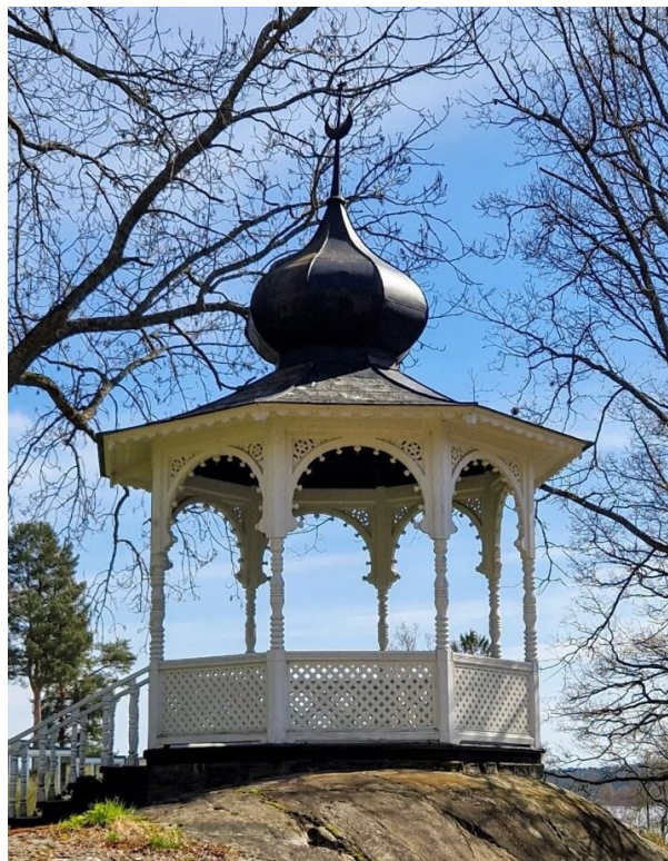
Gamla Villa Metsolas moriska paviljong från 1893.