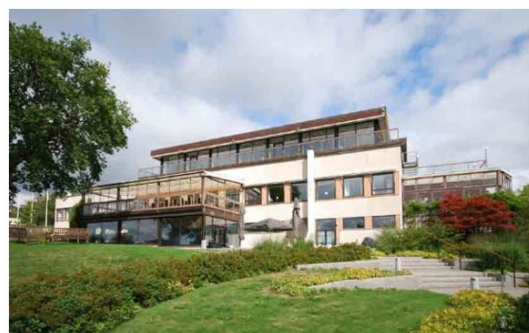
Rönneberga karaktäriseras bl.a. av anläggningens trädgårdspartier, inramade av betonggjutna terrasser och trappor i sluttningen mot sjösidan.

På 1960-talet lades stor omsorg ned på att komponera in trädgårdsanläggningen i den kuperade sluttningen. Karaktäristiska är terrasspartierna gjutna i betong. Gjutna betongtrappor bär av terrängens stora nivåskillnader och binder samman anläggningens olika delar. Tidstypiska järnräcken karaktäriserar hela anläggningen. Den strikta nästan minimalistiska trädgårdsstrukturen inramas av den omgivande sluttningens frodiga grönska vilket skapar en intressant helhet.