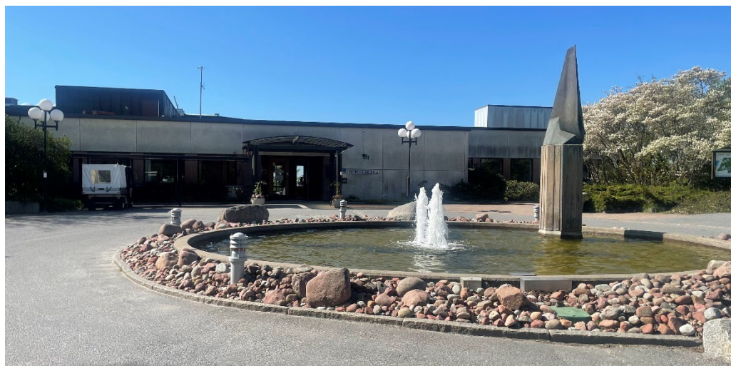
Rönneberga kursgård, huvudentrén med fontän.

Anläggningen karaktäriseras av de långsträckta låga souterränganpassade byggnadskropparna i den branta sluttningen. Karaktäristiskt är även användningen av prefabricerat fasadmaterial med ljusa betongskivor. De rytmiskt återkommande mörka bröstningarna är sekundärt utförda i mörkbrun plåt. Typiska är även de långa mörka fönsterbanden (ursprungliga fönster är utbytta), samt platta tak, inklusive kvarvarande ursprungliga entrépartier i lackad ek och med glasrutor. Vissa entrépartier har byggts om i sen tid. Den betydelsefulla huvudentrén bevarar ekdörrar, glas och stor rustik granitportal, sistnämnda kanske inte helt ursprunglig men troligen tillkommen på 1970-talet. Kvarvarande äldre entrépartier är synnerligen angelägna att bevara. Sjösidans stora souterrängfasad har glasad över- och utbyggnad. Det finns även ett begränsat husparti med fasad i rött tegel och överbyggnad i mörk ståndfalsad plåt.