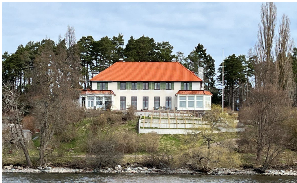
Villa Elfviks udde.