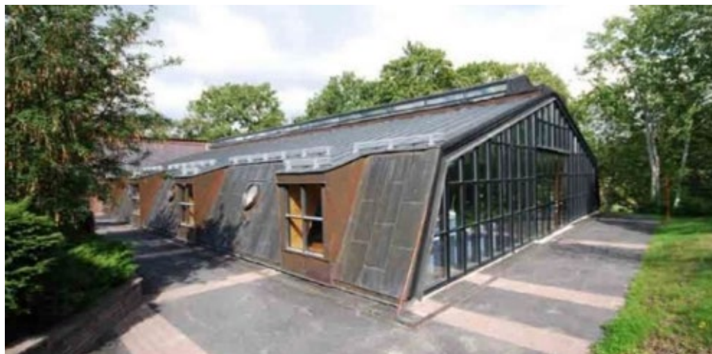
Badhuset tillkom på 1980-talet och har byggts om i senare tid.

Strax intill personalbostadshuset ligger ett badhus. Det var ursprungligen bara en pool från 1968 som byggdes in 1987 efter ritningar av CAN Arkitektkontor. Byggnaden är typisk för strömningar under 1980-talet och är ett intressant tillägg med sina låga volymer, sin uppbrutna fasad, kopparplåt, falsat plåttak och uppglasade gavel. Interiören som formats i två etapper är karaktärsfull och tillför också Rönnebergaanläggningen stort värde.