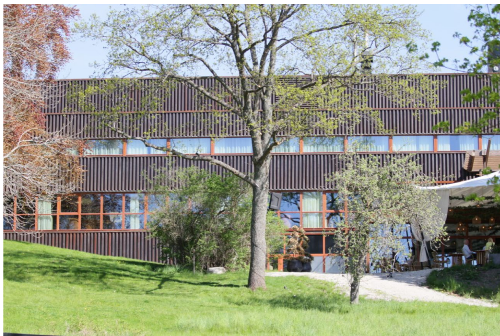
IBM:s före detta kursgård, fasad mot söder.

Valet av plats längst ut på Lidingö var ett sätt att hålla verksamheten och deltagarna på avstånd från stadens brusande liv och distraktioner. Anläggningen behövde ingen uppmärksamhet, det var utbildningsverksamheten som var det viktiga.