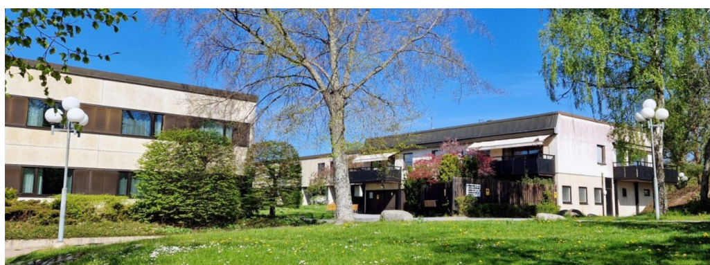
Rönneberga kursgård, hotellbyggnad väster om huvudbyggnaden.

Anläggningen karaktäriseras av de långsträckta låga souterränganpassade byggnadskropparna i den branta sluttningen. Karaktäristiskt är även användningen av prefabricerat fasadmaterial med ljusa betongskivor. De rytmiskt återkommande mörka bröstningarna är sekundärt utförda i mörkbrun plåt. Typiska är även de långa mörka fönsterbanden (ursprungliga fönster är utbytta), samt platta tak, inklusive kvarvarande ursprungliga entrépartier i lackad ek och med glasrutor. Vissa entrépartier har byggts om i sen tid. Den betydelsefulla huvudentrén bevarar ekdörrar, glas och stor rustik granitportal, sistnämnda kanske inte helt ursprunglig men troligen tillkommen på 1970-talet. Kvarvarande äldre entrépartier är synnerligen angelägna att bevara. Sjösidans stora souterrängfasad har glasad över- och utbyggnad. Det finns även ett begränsat husparti med fasad i rött tegel och överbyggnad i mörk ståndfalsad plåt.