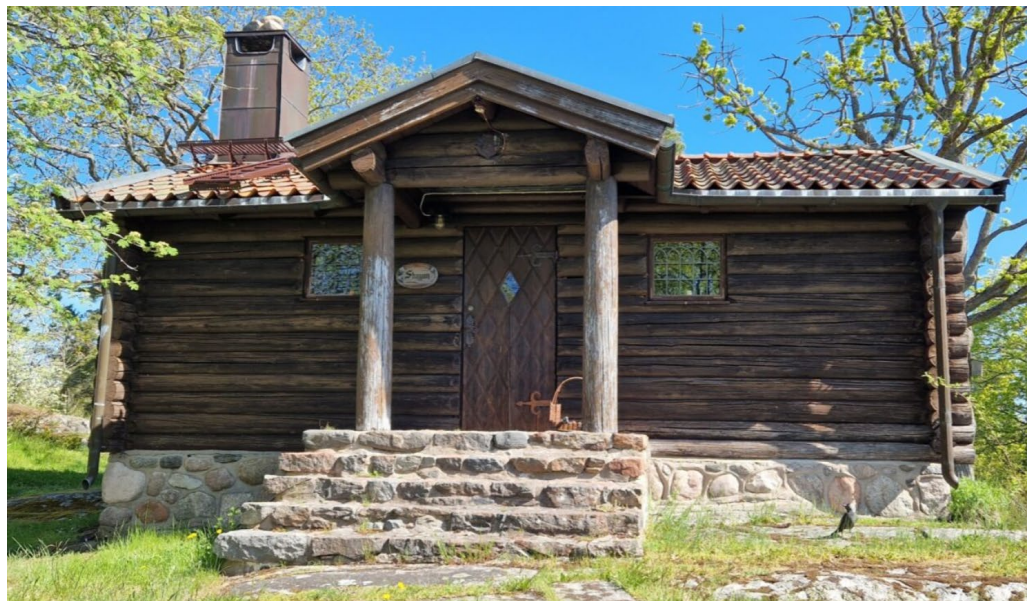
Den lilla sportstugan som har kvar sin 1910–1920-talskaraktär.