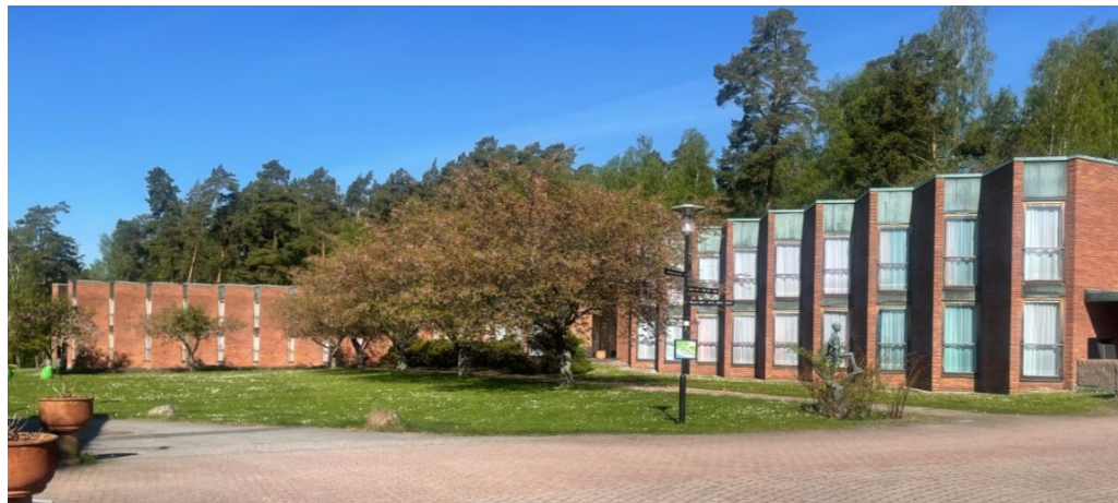
Skogshems karaktärsfulla sågtandsfasader.

huskroppar och uppbyggda tegelmurar ger också motsvarande karaktär och variation.