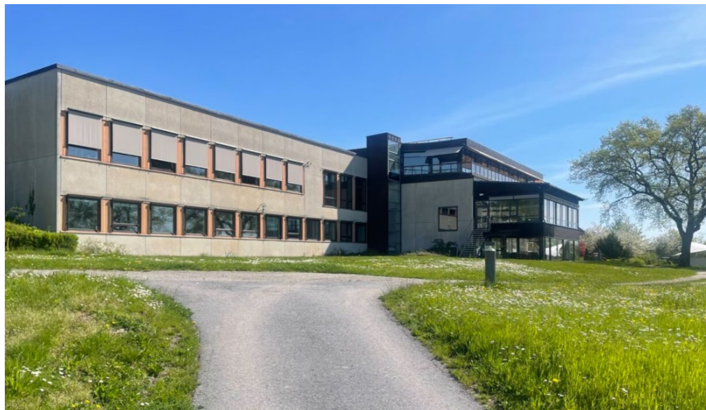
Rönneberga kursgård, huvudbyggnadens fasad mot sjösidan.