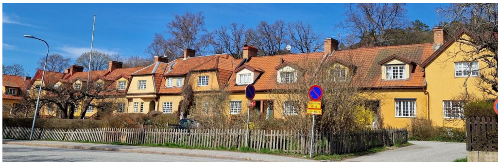
Canadaradhusen med trädgårdar mot Elfviksvägen.

Husen har genomgått förändringar över tid som till exempel några utbytta entrédörrar och entrétrappor, några sentida helglasade fönster samt avvikande kulörer. Förgårdsmarken är inramad av häckar och har i många fall rik växtlighet. På norrsidan ligger små, ofta hårdgjorda gårdar. Små smala förrådsbyggnader skiljer tomterna åt, förråden är sentida. Anläggningen har tydliga referenser till engelsk radhusarkitektur och till arts- and crafts-rörelsen.