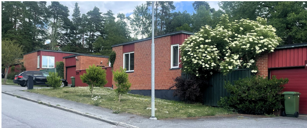
Atriumvillorna vid Boholmsstigen.