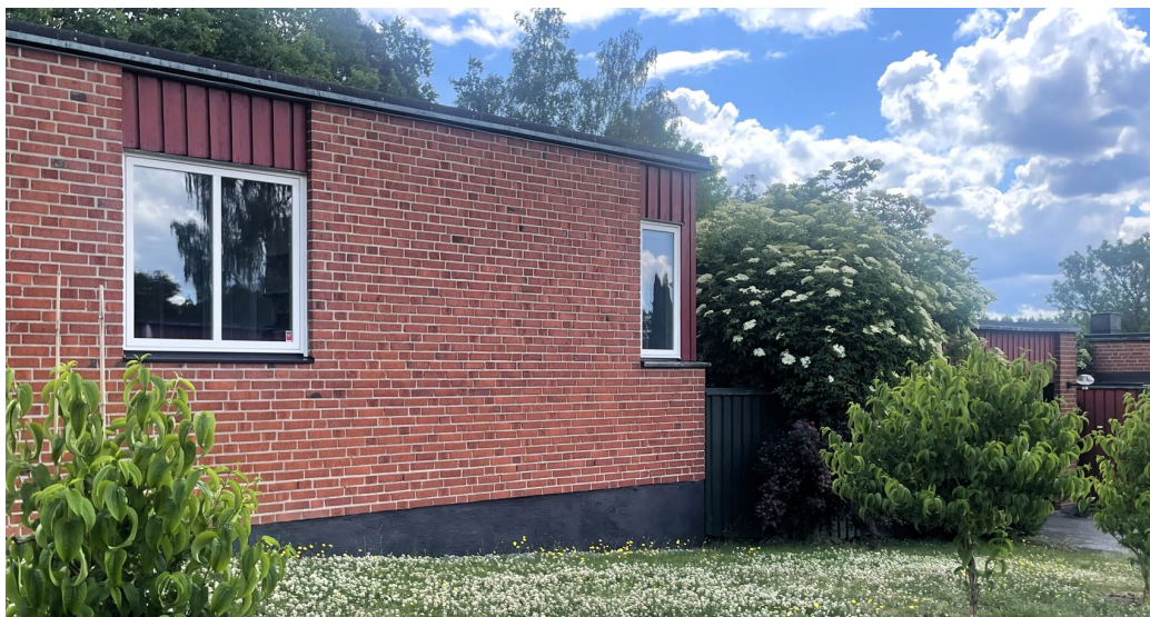
Atriumvillorna vid Boholmsstigen.