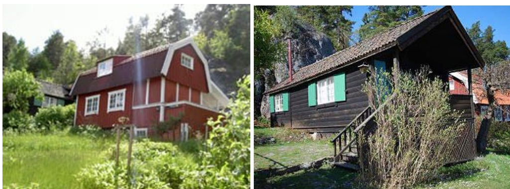
Stugorna på lotterna 12 (vänster bild) och 13 (höger bild).

Lott 13 från 1911–1915 blev tidigt förlängd och fasadomvandlad till 1920-talets sportstugeprägel. Huset har kuprinolbrun stockpanel, vita tätspröjsade fönster och gröna fönsterluckor. Huset är tillbyggt. Lott 14 som har grönmålad liggande fasspångpanel har en utveckling som påminner om grannstugan på 13, men med en lite äldre karaktär. Här finns också flera ursprungliga fasaddetaljer såsom blyspröjsade fönster. Huset är utbyggt bakåt och har en lite yngre veranda.