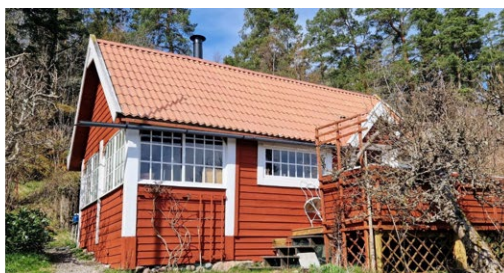
Två av kolonins äldsta stugor återfinns på lotterna 10 (vänster) respektive 11 (höger).