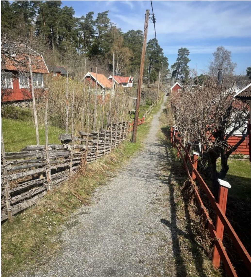
Grönstakolonin är samlad på ömse sidor av en smal gångväg, "bygatan".