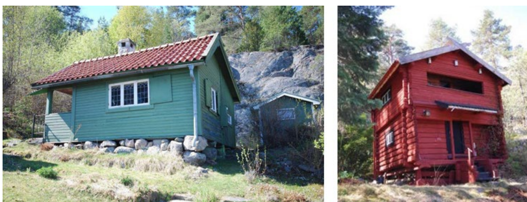
Lott 14 till vänster och Härbret på lott 15 till höger.

Lott 15 omfattar ett tvåvånings falurött knuttimrat härbre av dalakaraktär som lär ha flyttats till platsen för att bli fritidshus år 1924. Både att återanvända äldre uthus och att bygga nya fritidshus i "dalastil" förekom vid denna tid. Enligt uppgift från Miljö- och stadsbyggnadskontorets arkiv har timret i härbret dock visat sig vara behandlat med stenkoltjära som inrymmer miljögiftet kreosot. En originell utformning har dasset på lott 15 som är kamouflerat till en vedstapel.