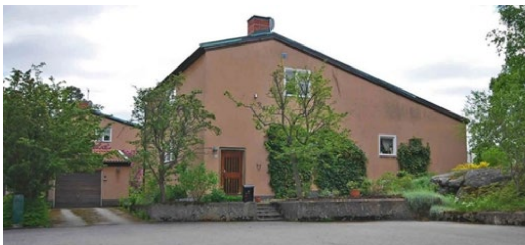
Längs Järpstigens sydvästra sida ligger fyra enhetligt utformade villor. Orren 14-17. Husen uppfördes i två våningar 1962-1963. Orren 16.

På 1960-talet byggdes fyra enhetligt utformade villor i kvarteret Orren på Järpstigen, som var mycket moderna för sin tid. Husen ligger grupperade två och två och är uppförda i två våningar med strama slätputsade fasader och stor omsorg i detaljerna. Husen har flacka sadeltak som är neddragna i ett och samma fall över den bakre vinkeln vilket skapar ett egensinnigt arkitektoniskt uttryck. Häckar och formklippta buskar ramar in de uppvuxna villatomterna mot gatan.