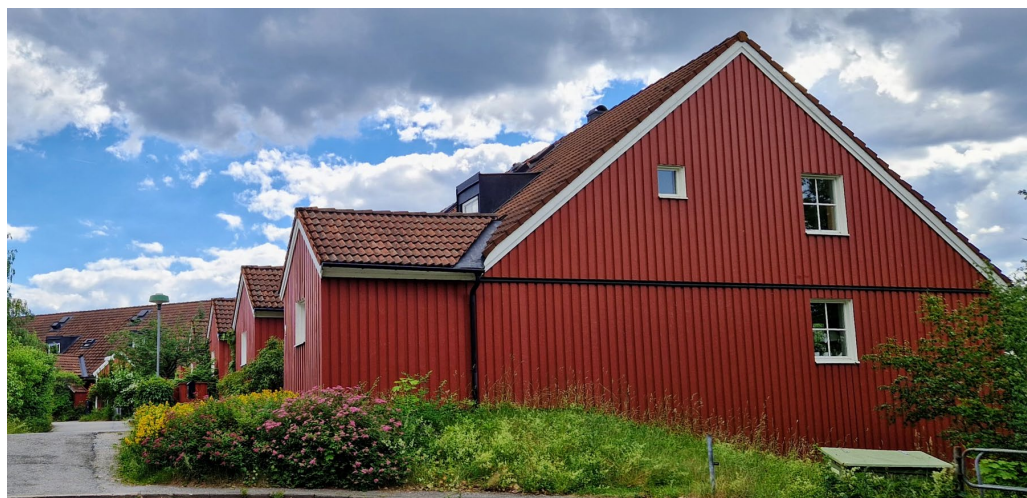
Ängsklockevägen från 1970-talet.