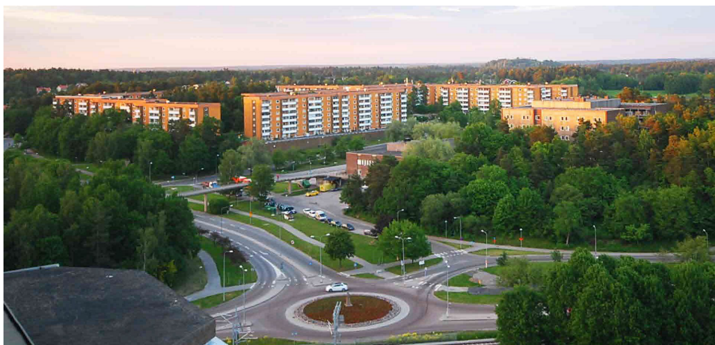
Hela sydvästra Gångsätra domineras sedan 1976 av Högsätra flerbostadsområde.

Dagens Gångsätra bär stark prägel av 1900-tal. Hela sydvästra Gångsätra domineras sedan 1976 av Högsätra flerbostadsområde samt det lilla stadsdelscentrumet kring Lidingö sjukhus som byggdes under samma tid. I dag finns inte mycket kvar av centrumfunktionerna i Gångsätra och sjukhuset är nerlagt och används för olika typer av omsorgsboende.