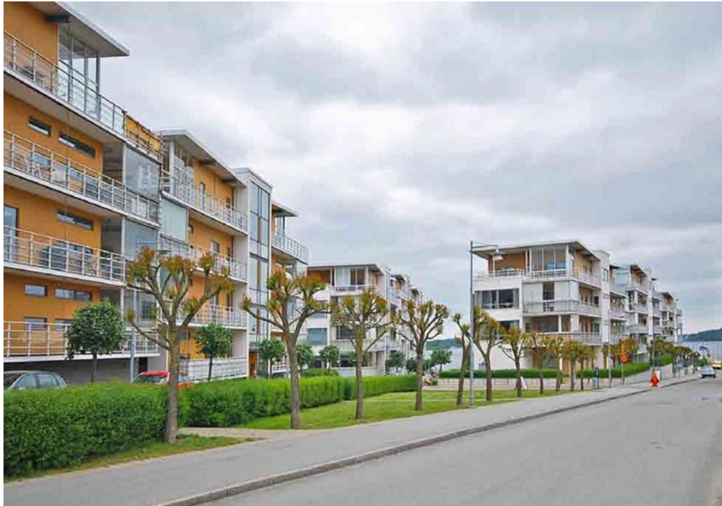
Gåshaga pirar uppfördes under den stora om- och nybyggnationen av Gåshaga åren 1999–2009.