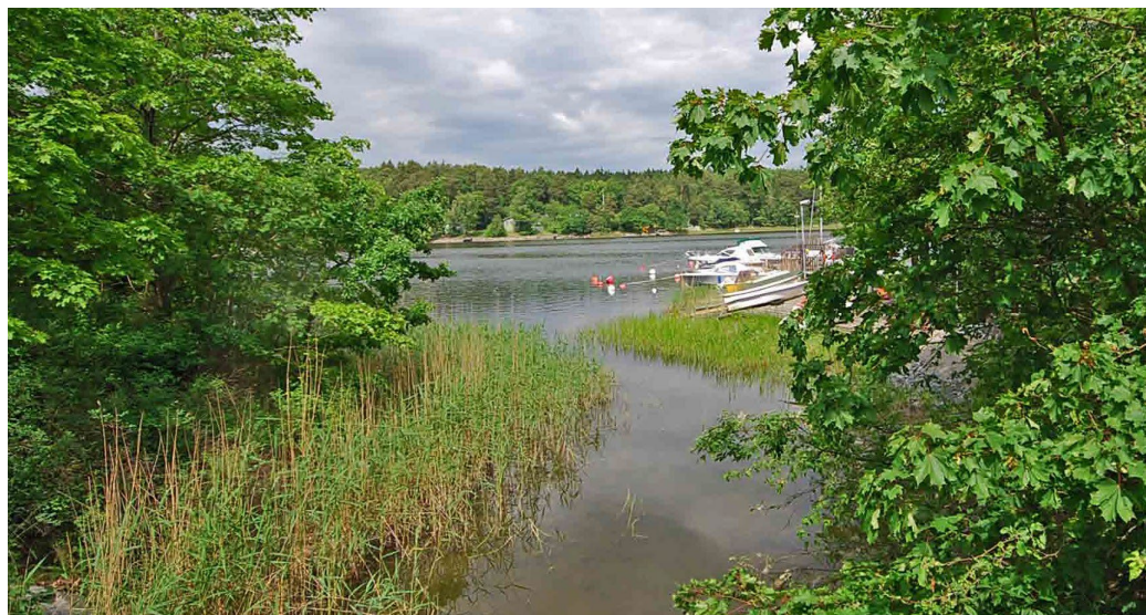
Ekholmsnäs sund avgränsar Killinge från Ekholmsnäs.

På sydöstra delen av Lidingö är skärgårdsterrängen påtaglig och bergknallarna en utpräglad del av landskapet. Samtliga tre stadsdelar, Gåshaga, Killinge och Käppala, har namn efter gårdar som alla är borta sedan länge.