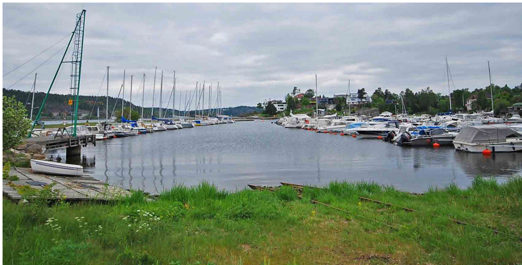
Käppala hamn 2014. Här låg i slutet av 1800-talet Käppala Ångsågs AB som var en storindustri.

i verksamhet till ungefär 1925. Gåshagafabriken lär ha haft ca 70 anställda som mest.