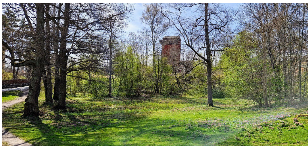
Kvarndammsparken med fickparken kring dammen. Nässets kvarn som flyttades till platsen 1845 skymtar i bakgrunden.

Mycket påtaglig är den småskaliga faluröda gamla kvarnmiljön från 1840-talet på Nässets kvarn (Lidingö 7:250) bland bergknallar och träddungar. Själva kvarnen är en fotkvarn flyttad hit från Stockholm 1845 och den före detta mjölnarbostaden är en låg timrad stuga. Kvarnen är en del av miljön kring Kvarndammsparken som öppnar sig norrut ner mot korsningen med Stockholmsvägen. Den lilla Kvarndammsparkens norra del omfattar damm med viloplats, gräsmatta och trädgrupper. Parken är en fickpark som ur kulturhistorisk synpunkt har en genuin karaktär av efterkrigstidens 1940- och 1950-tal.