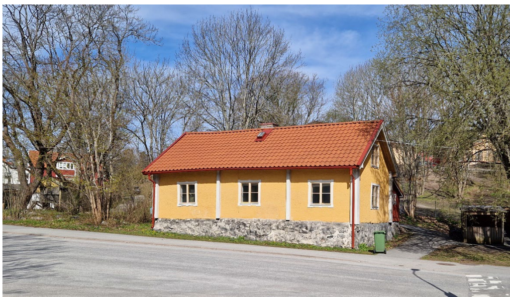
Näsets vägkrog från 1700-talet vid Stockholmsvägen, öns huvudstråk sedan länge.

Kring det viktiga gamla vägkrysset Kvarnvägen/Stockholmsvägen ligger flera typiska byggnader som var centrala i agrarsamhällets Lidingö. Ovanför vägkorsningen, karaktäristiskt helt i linje med Stockholmsvägens dragning, ligger Näsets före detta vägkrog som var i bruk redan under 1700-talets senare del. Den gulputsade lilla knuttimrade byggnaden har en välbevarad exteriör och är en av det gamla Lidingös karaktärsbyggnader (Klockaren 1). Intill den före detta vägkrogen ligger Nynäs som uppfördes i en enkel panelarkitektur 1879 och inrymde en av de första handelsbodarna på Lidingö, (Handelsboden 1).