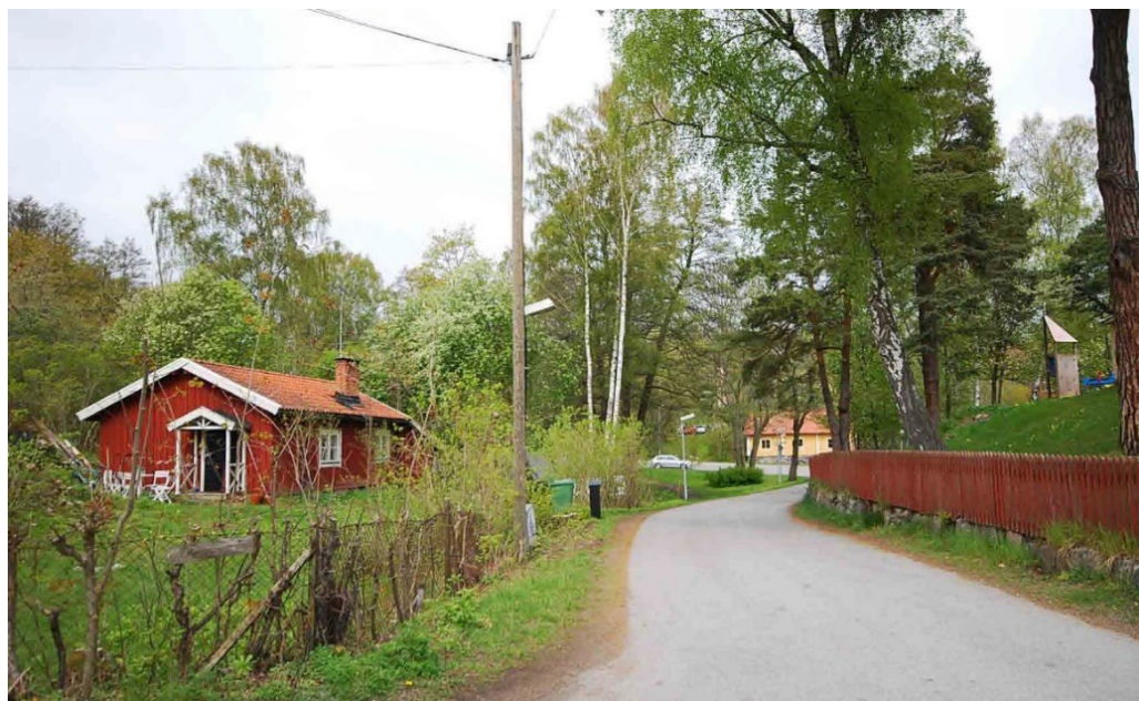
Från Kyrkallén övergår vägen norrut i den smala ringlande Kvarnvägen.

Mycket påtaglig är den småskaliga faluröda gamla kvarnmiljön från 1840-talet på Nässets kvarn (Lidingö 7:250) bland bergknallar och träddungar. Själva kvarnen är en fotkvarn flyttad hit från Stockholm 1845 och den före detta mjölnarbostaden är en låg timrad stuga. Kvarnen är en del av miljön kring Kvarndammsparken som öppnar sig norrut ner mot korsningen med Stockholmsvägen. Den lilla Kvarndammsparkens norra del omfattar damm med viloplats, gräsmatta och trädgrupper. Parken är en fickpark som ur kulturhistorisk synpunkt har en genuin karaktär av efterkrigstidens 1940- och 1950-tal.