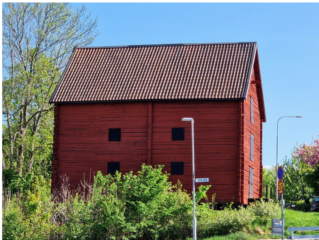
Längre söderut från kyrkan står Hersby gårds stora faluröda timrade spannmålsmagasin från tidigt 1800-tal.