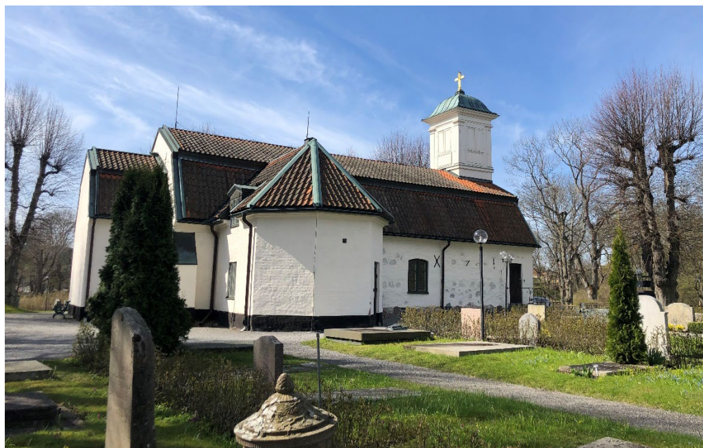
Vy mot Lidingö kyrkas södra fasad.

Lidingö kyrka och kyrkogård bär med sig tydliga årsringar under flera hundra år av öns utveckling. Fastän kyrkan tillkommit först under tidig stormaktstid har den drag av senmedeltida roslagskyrka i gråsten. Exteriören präglas av långhusets slammade gråstensmurverk från 1623, västparti tillbyggt vid 1700-talets mitt, tegeltäckt mansardtak från 1756, smalare korparti från 1913, och sakristian från 1969. Till detta kommer ett klassicerande klocktorn i trä från 1817, över kyrkans västportal.