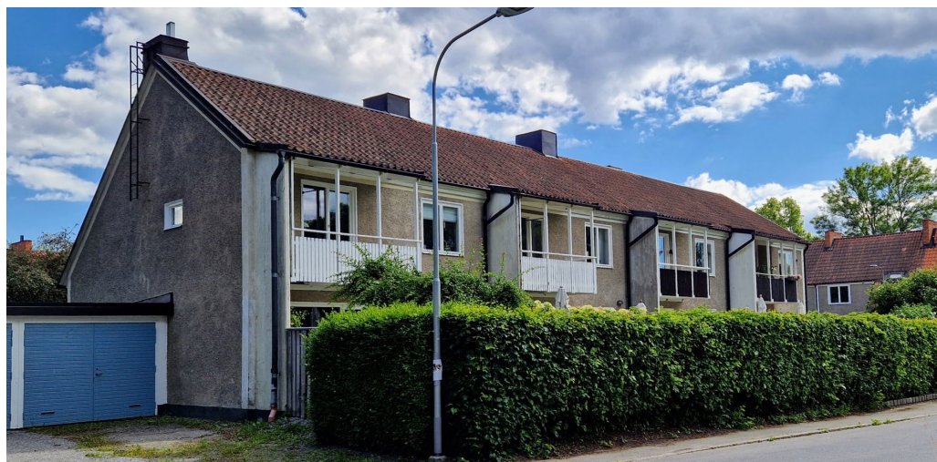
Baksidan av radhus längs med Laduvägen. Fasad mot Ekholmsnäsavägen.

Karaktärsfullt är områdets "centralgarage" från 1955 i kvarteret Hersbyhage. Garaget är en cirkelrund anläggning med 29 garageplatser, ursprungligen med slagdörrar som dock numera är ersatta med vipportar i brun plåt. Anläggningen har ett cirkelrunt "torg" med 26 meters inre diameter mot vilket de 29 garagen vetter. Fasaderna utåt är putsade och ljusgrå. Anläggningen har ett pulpettak som lutar in mot gården.