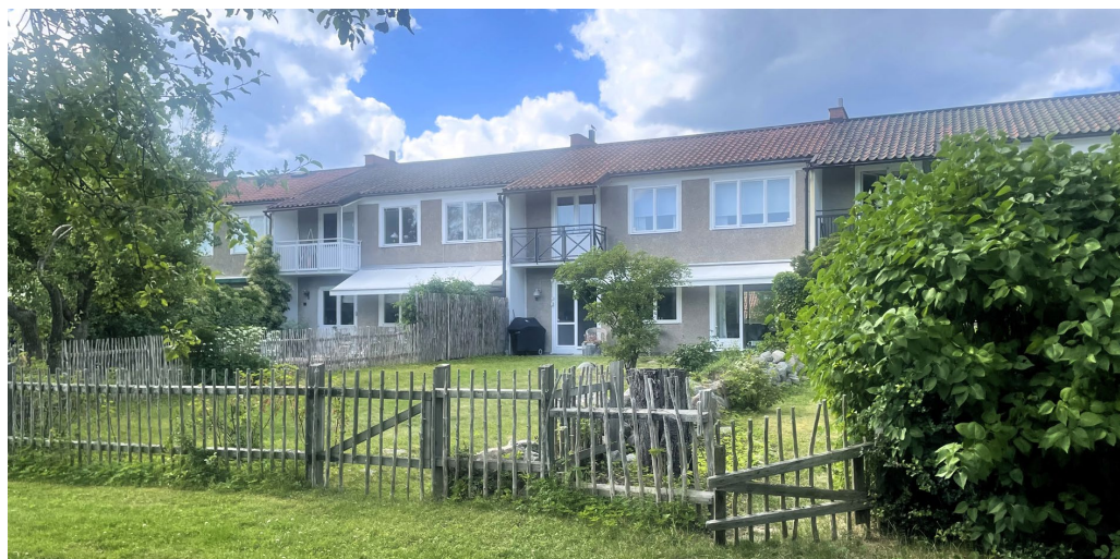
Hersby Gärde. Områdets mycket välbevarade, välplanerade grundstruktur från 1948-1950 framträder tydligt.