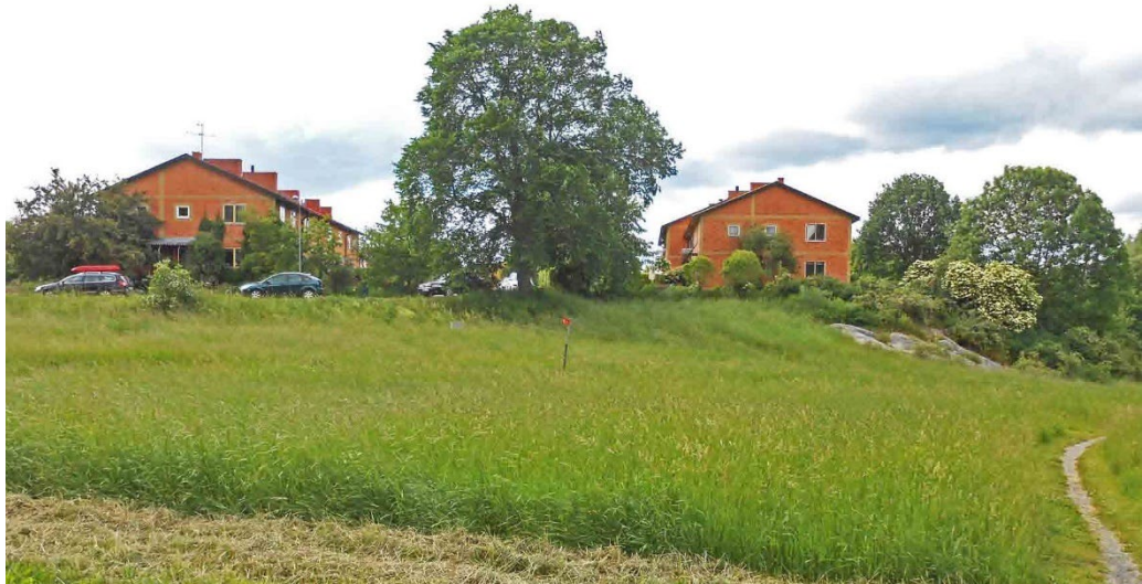
Bebyggelsen i Hersby Åker är placerad på en höjd i landskapet.