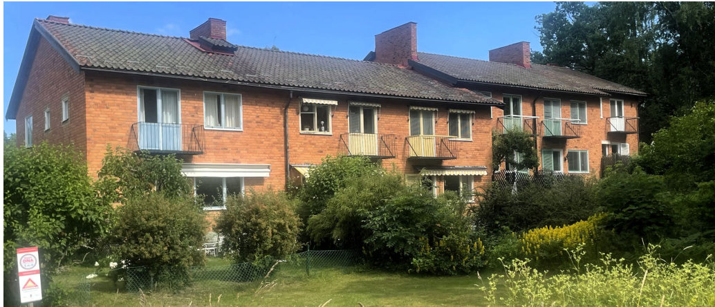
Baksidorna av radhus längs med Åkervägen.