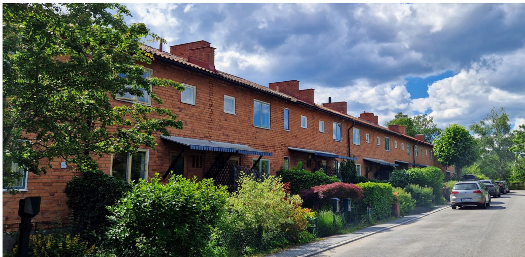
Radhus längs med Gärdesvägen.