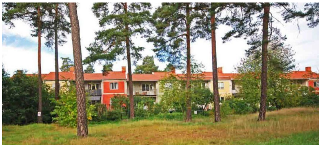
Vy mot Heimdal 1 från den lilla park som vetter mot kvarteret Tor i söder.