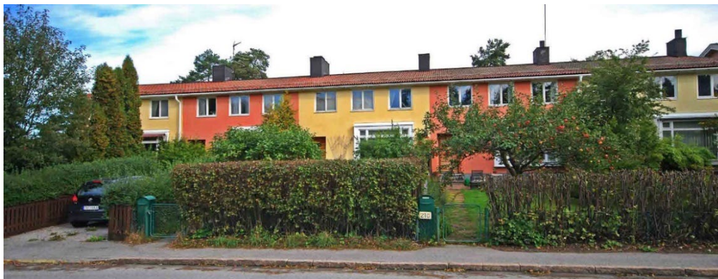
Svalkan 3–7 ritades av Björn Hedvall 1948–1949.

Radhuslängorna har slätputsade fasader av brädriven slätputs med en karaktäristisk sen 1940-talsfärgsättning. De klara ljusa mättade färgerna, kombinationer av rött, brutet vitt, gult och grönt, markerar även husindelningen i längornas fasader. Endast några medvetna avsteg har gjorts från färgkombinationen för att åstadkomma en liten men harmonisk variation. Den 1950 tillbyggda Skuggan 10–11 på Skuggan 6 är putsad i mättad pastellkulör i ljusrosa respektive ljusgult. Svalkan 3–7 är färgsatt i blekgult och blekrött.