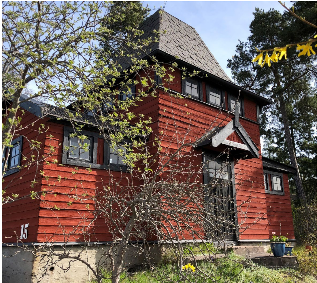
Det lilla pumphuset i nationalromantisk stil med liggande träpanel i falurött.

Norra Islinge har en mer småskalig karaktär av villastad än området i söder. Först efter 1923 var avstyckningen i gång norr om Norra Kungsvägen. Där bebyggdes ett stort område med villor med stildrag av 1920-tals klassicism och funktionalism under främst 1930- och 1940-talen. I slutningen mot Islingeviken ligger en av Islinges märkesbyggnader, funkisvillan inom Ravinen 15, ritad 1935 av arkitekt Sture Frölén (1907–1999). Med slätputsade ljusa fasader, fönster i fasadliv, pelare, utskjutande balkonger, samt asymmetriskt komponerade fasader som återspeglar interiörens rumsfunktioner kommer den radikala funktionalismen här till fullödigt uttryck.