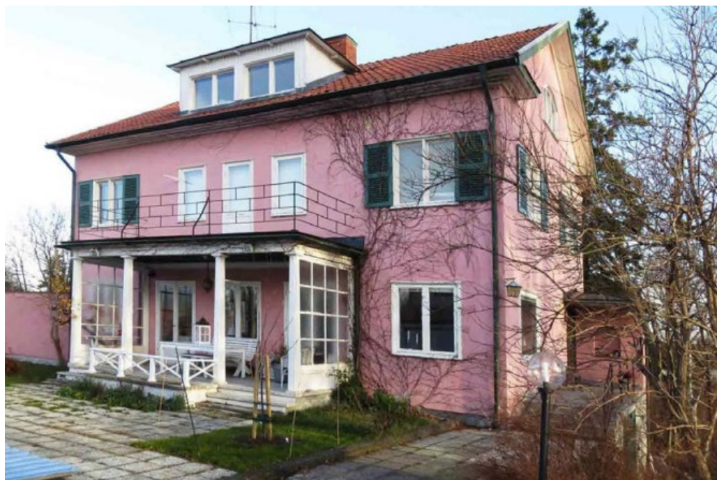
Hjässan 9 ritad av Einar Rudskog 1935 och har en klassicerande loggia med lågt kryssräcke och stora profilerade taksprång. Den rosa putsen är lekfull och samspelar fint med de gröna fönsterluckorna.