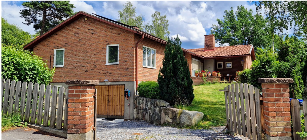
Högplatån 40 ritad av Lennart Erksammar 1949, utförd i tegel med vinkelbyggd huskropp.