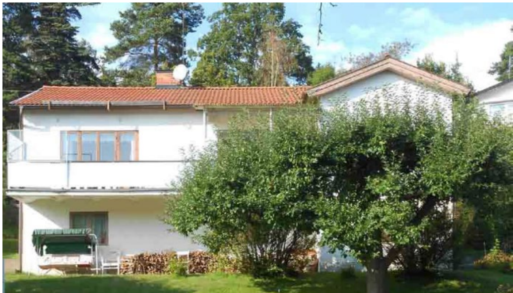
Solsidan 10 är ett BORO-hus uppförd 1935 i det som kan kallas ”folkhemsfunkis”.

Kataloghusföretag tillhandahöll både mindre villor och större som kunde anpassas individuellt efter en mer välsituerad kunds önskemål, till exempel Solsidan 10, uppförd 1935 och Solsidan 15, från 1933, båda från Borohus. De lanserade villor både i en mer avancerad funktionalism och i den mer vanliga, enklare ”folkhemsfunkisen”.