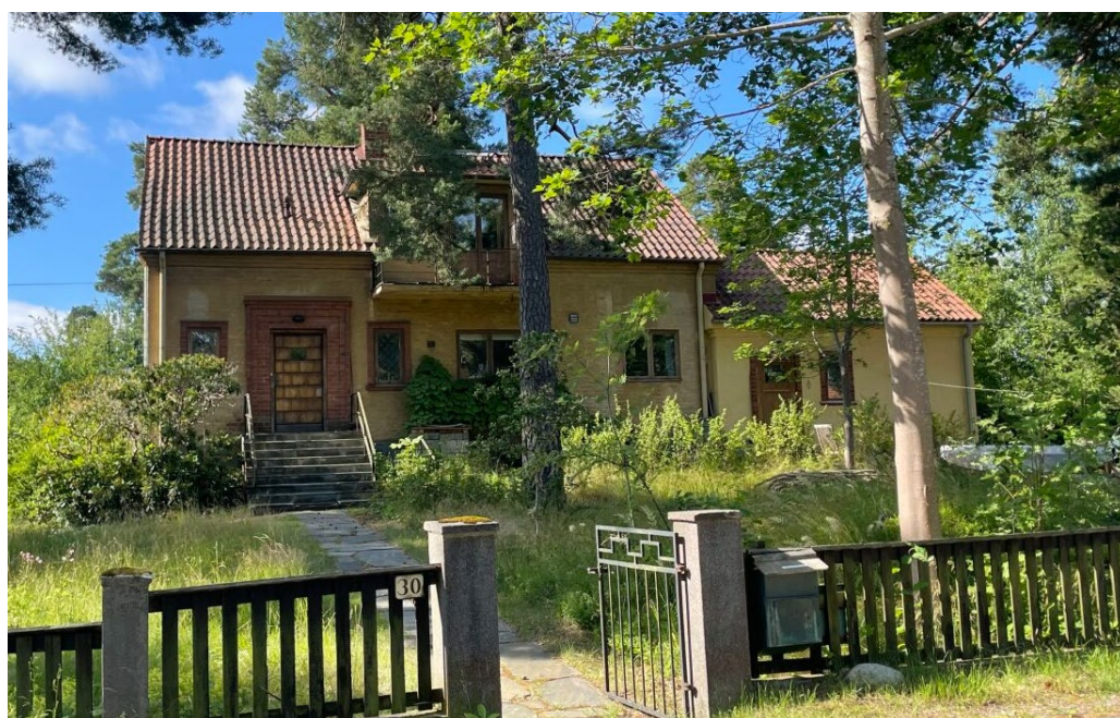
Åsen 19 är ritad av Einar Rudskog 1939 och har ett expressivt uttryck med tydligt klassicerande anslag med den profilerade gesimen som bär upp taket och entrédörrens tunga omfattning i tegel.