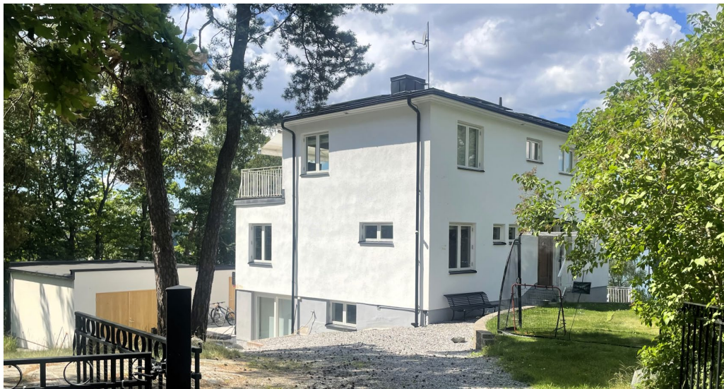
Tordönet 2 ritad av Anders Hedbom.

Ett flertal av villorna är av mycket god arkitektonisk kvalitet, i mer eller mindre ursprungligt skick och mycket typiska för sina respektive tillkomsttider.