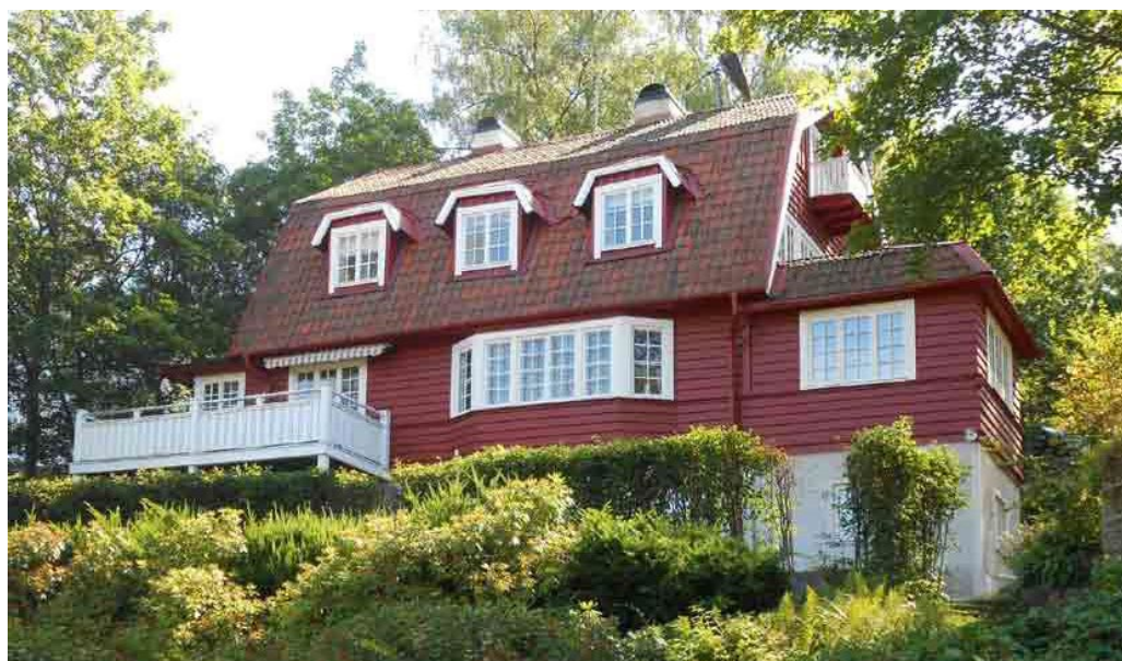
Villan inom Betula 2 ritades av arkitekt Axel Sjögren (1877–1962) och uppfördes 1906. Huset har stildrag av både jugend och nationalromantik och är en av de äldsta villorna i området.