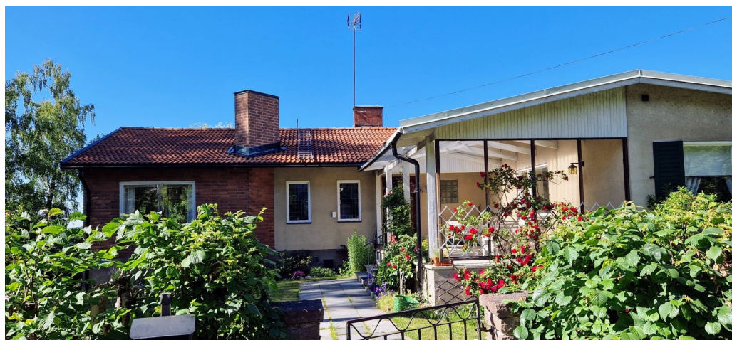
Betula 15 längs med Albavägen är uppförd 1958.