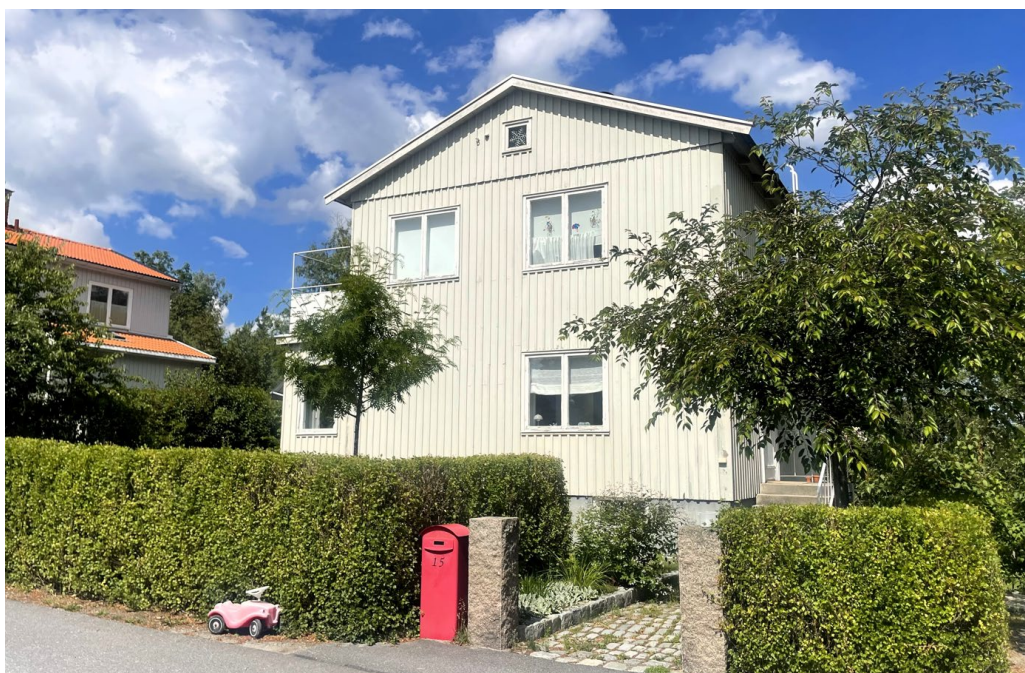
Krokusen 8 (Krokusvägen 15) är exempel på den småskaliga egnahemsbebyggelsen längs med Krokusvägen.

Skalan i området är ännu lågmäld och enkel, gaturummet tydligt definierat. Trädgårdarna är fortfarande oftast enkla och passar väl ihop med bebyggelsens anspråkslösa karaktär. Mitt i området, i kvarteren Snödroppen och Tulpanen, finns en torgliknande platsbildning. Vegetationen inom området består främst av högvuxna tallar och lövträd som lönn och ek.