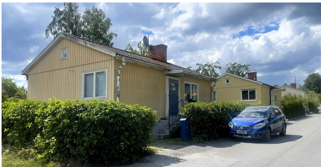
Snödroppen 8 (Krokusvägen 10) är exempel på den småskaliga egnahemsbebyggelsen längs med Krokusvägen.