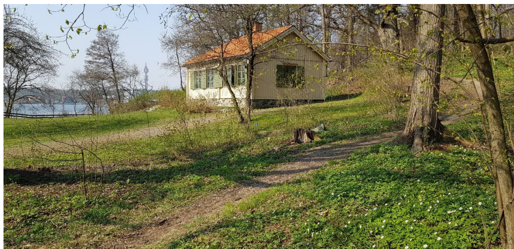
Larsbergs Brostuga ligger invid Larsbergs brygga.