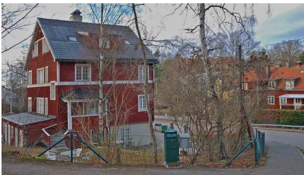
Linneavägen mellan kvarteren Linnean och Vitmossan.