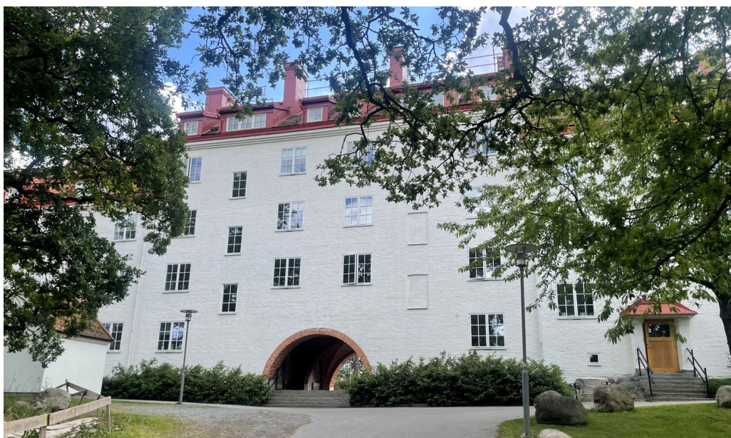
Mittvägshuset från 1914 är en av Lidingös kulturhistoriska karaktärsbyggnader.

Kärnan i Bergsätra består av det monumentala långsträckta bostadshus med arbetarbostäder till AGA som Fastighets AB Bergsätra lät bygga 1914. Arkitekten Erik Hahr gav huset en dominerande placering på bergsryggen och en påtaglig nationalromantisk stram utformning. Den stora volymen med putsad fasad, tegelvälvd passage, spröjsade fönster, höga tegeltak och entréer i rad sätter fortfarande en stark prägel på området. Efter 2000-talets förtätningar med stora flerbostadshus i omgivningen har den mäktiga upplevelsen av det stora Bergsätrahuset minskats, men har ändå fortfarande en central betydelse i helhetsmiljön (Stensötan 1).