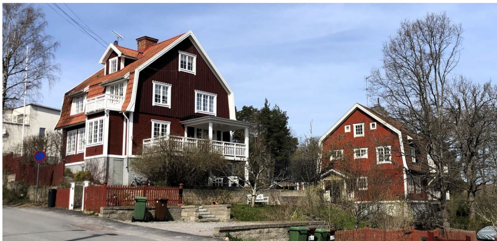
Kvarteret Vitmossan vid Bergsättravägen med friliggande villor omgivna av luftiga villatomter. Husen är byggda i 1½–2 våningar med faluröd panelfasad, vita tätspröjsade fönster och snickerier samt ett brutet takfall som är långt neddraget på långsidorna.