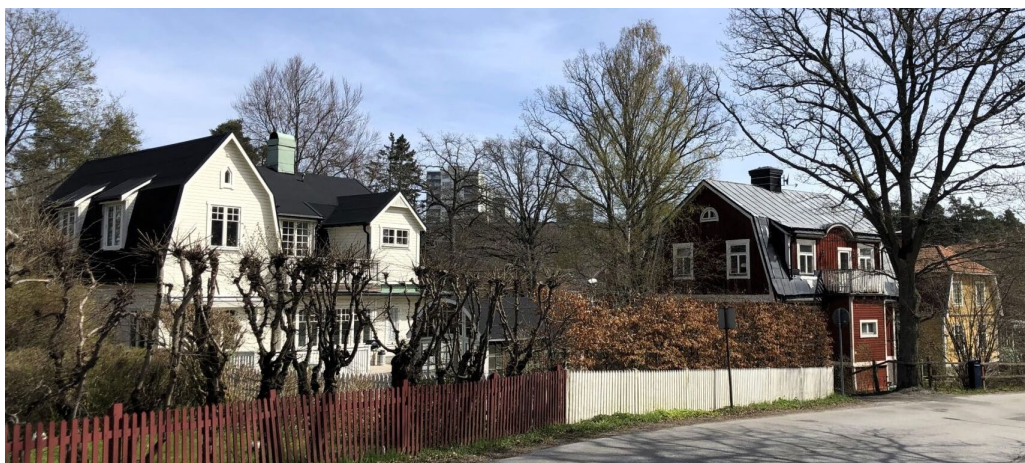
Fastigheterna Vitmossan 7 och Lidingö 10:359 längs med Bergsättravägen.