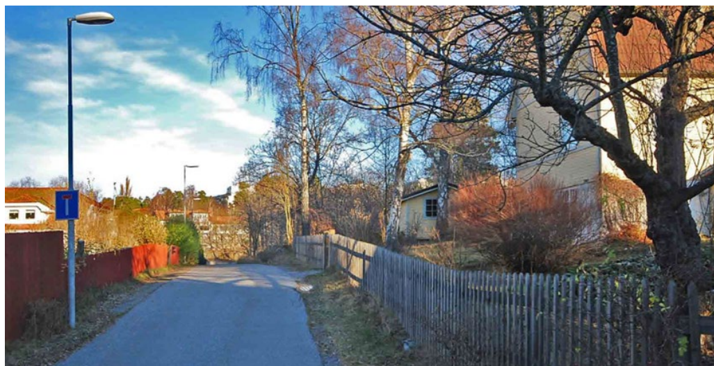
Törnrosvägen vid kvarteret Krolliljan.

I dag är det framför allt i stråket mellan Liljevägen i väster och Parksättravägen i öster som den mest sammanhållna äldre villakaraktären finns i behåll. Kvarter som Vitfrylen samt delvis Krolliljan, Majvivan och Myskmadran har fortfarande många genuina karaktärsdrag från 1905–1925.