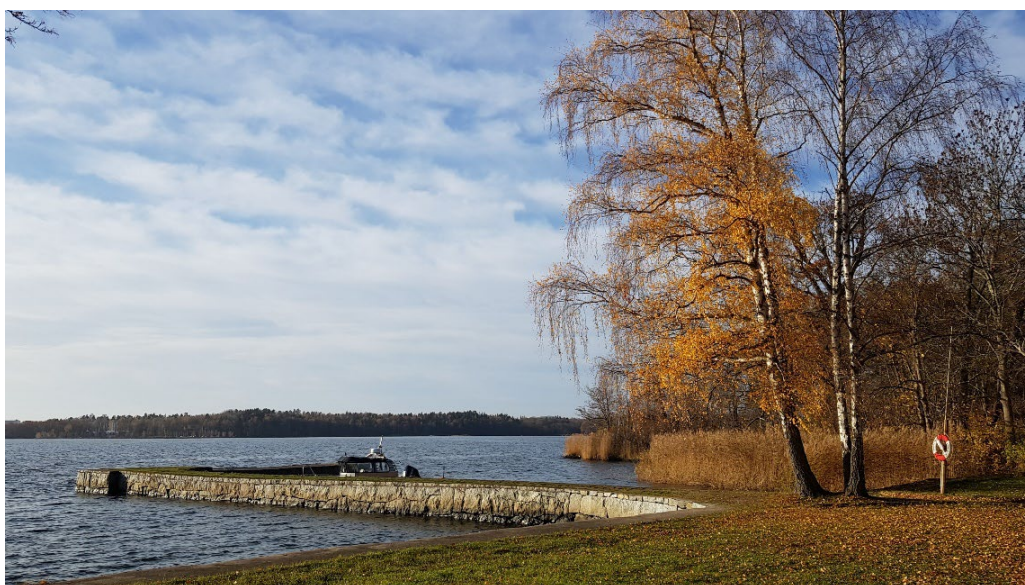
Nysättras ångbåtsbrygga och strandskoning.

Sydost om Kappsta ligger Nysätra. Ingen av sommarvillorna från sent 1800-tal finns i dag bevarad. De befintliga yngre bostadshusen har däremot ursprung från dem och rester av exempelvis stenbrygga med strandskoning och skyddande pirarm påminner om den äldre bebyggelsen. I dag är platsen en av Lidingös främsta små strandanknutna maritima kulturmiljöer med rötter i 1800-talet (Lidingö 10:158).