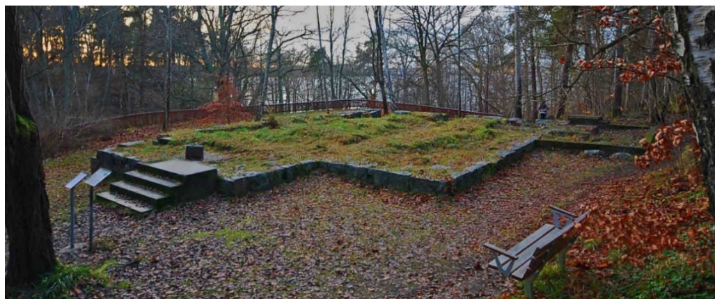
Kappsta med ruinen efter sommarvillan som brann 1933. Raoul Wallenbergmonumentet till vänster i bild nära trappan. (Lidingö 10:158.)

Redan 1882 uppfördes sommarvillan Kappsta av professor P. J. Wising. Villan fick sitt namn efter Kappsta gård i Södermanland och Wising kom sedermera att bli morfar till Raoul Wallenberg som föddes här 1912. Efter att villan brann ner 1933 skedde inga ytterligare byggnationer och villaträdgården med sina exotiska växter förvildades. Kappstaområdet förvärvades 1986 av Lidingö stad och kom att bli ett naturreservat för att skydda den unika floran.