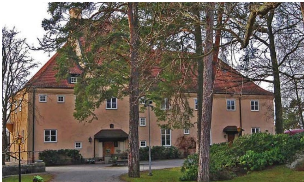
Villa Ekbacken ritades av arkitekt Erik Hahr och uppfördes 1912 som bostad för Gustaf Dalén.

Karaktäristiskt för utbyggnaden mellan 1905–1925 längs Törnrosvägen var lite enklare utformade trävillor i 1 ½ plan med fasad i ljusmålad eller faluröd spåntad panel. Husen försågs ofta med en veranda eller en öppen förstukvist vid ingången. Sadeltak förekom men tegeltäckt brutet tak dominerade. Det byggdes även några putsade villor för tjänstemän i området som trots förändringar bevarar sina ursprungsdrag. Tomtstrukturen växlar inom kvarteren och är relativt oregelbunden men varje hus hade ursprungligen en rymlig tomt för självförsörjning genom köksodlingar, bärbuskar och fruktträd. Den äldre tomtkaraktären är fortfarande ett kännetecken för Törnrosvägen och på vissa ställen finns bevarade spjälstaket eller klippta lövhäckar som ramar in tomterna mot gatan kvar. Tidstypiska grindstolpar och grindar i trä eller smide är också ett karaktärsfullt inslag längs gatan.