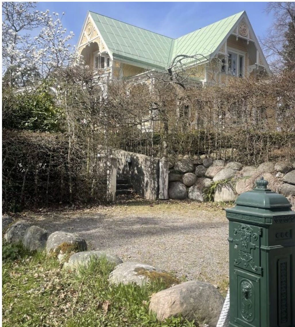
Villa Solbacken är en sommarvilla från 1882–1883.

Enstaka små egnahem tillkom redan efter sekelskiftet 1900. Några större privatvillor uppfördes också. Framför allt lät AGAs grundare Gustaf Dalén uppföra sin monumentala bostad Villa Ekbacken 1912 vid Törnrosvägens västra del. Villan är djupt indragen på tomten med sina tunga nationalromantiska byggnadsvolymer och omgärdas av murar i ljus puts som avgränsar mot gatan och sätter prägel på gaturummet längst i väster.