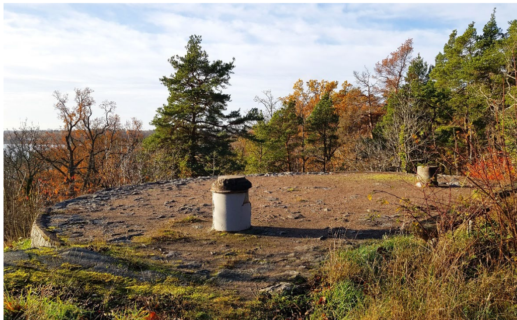
Av villan Nidaros finns bla lämningar en terrass med utblick över Lilla Värtan.