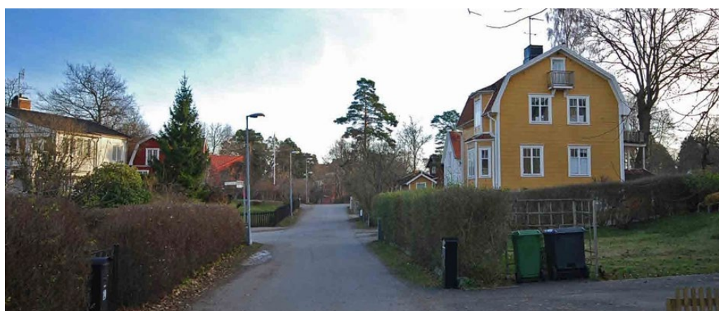
Törnrosvägen vid kvarteret Vitfrylen.

Karaktäristiskt för utbyggnaden mellan 1905–1925 längs Törnrosvägen var lite enklare utformade trävillor i 1 ½ plan med fasad i ljusmålad eller faluröd spåntad panel. Husen försågs ofta med en veranda eller en öppen förstukvist vid ingången. Sadeltak förekom men tegeltäckt brutet tak dominerade. Det byggdes även några putsade villor för tjänstemän i området som trots förändringar bevarar sina ursprungsdrag. Tomtstrukturen växlar inom kvarteren och är relativt oregelbunden men varje hus hade ursprungligen en rymlig tomt för självförsörjning genom köksodlingar, bärbuskar och fruktträd. Den äldre tomtkaraktären är fortfarande ett kännetecken för Törnrosvägen och på vissa ställen finns bevarade spjälstaket eller klippta lövhäckar som ramar in tomterna mot gatan kvar. Tidstypiska grindstolpar och grindar i trä eller smide är också ett karaktärsfullt inslag längs gatan.