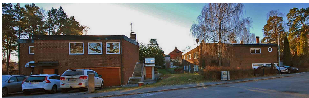
Tjärblomstret 1 och 2 ritades av arkitekten Peter Diebitsch 1962.

Tjärblomstrets villor ligger delvis i souterräng, har garage och förråd i bottenvåningen och en tvådelad vinklad huskropp med fasad i hårdbränt brunrött tegel. De har sinsemellan en likartad utformning. Byggnadernas likhet med bebyggelsen i Misteln är att de är uppförda i två våningar under papptäckt platt tak, gavelplacerad skorsten, samt mycket tidstypiska fönsterformer och entréer. Detaljer som bred taklist i koppar, småfönster, utanpåliggande trappor och de elegant utformade entréerna i något ljusare trä till bostad och garage knyter an till den tydliga prägel av arkitekturade villor.