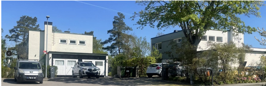
Misteln 15 och 13 vid vändplanen av Mistelvägen.