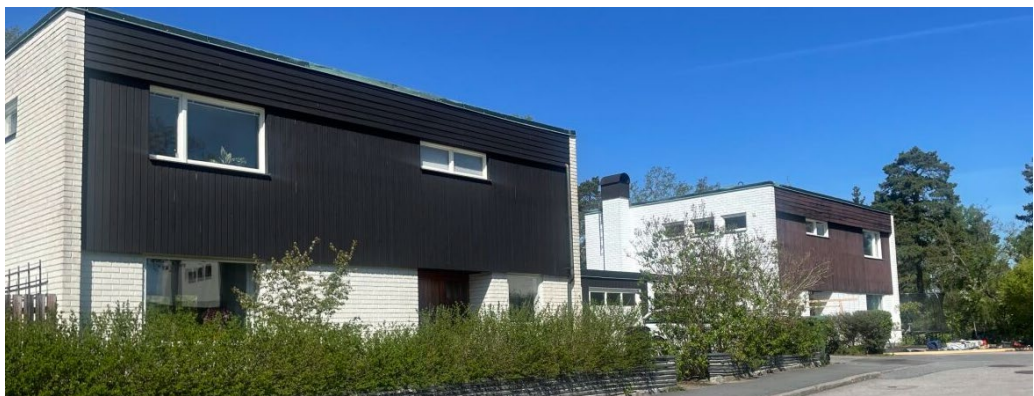
Fasaderna är i vitslammat tegel och brunlaserad stående panel. Den breda takfoten markeras med liggande panel under ett papptäckt platt tak. Garage och förråd i en våning är vidbyggda ena kortsidan. Fasaden i stående panel är antingen vitmålad eller brunlaserad. Misteln 4 och 14.

Garage och förråd i en våning är vidbyggda ena kortsidan. Fasaden i stående panel är antingen vitmålad eller brunlaserad och trädörrarna är vitmålade. Kedjehuset på Misteln 14 och 4 är utformade som villorna, skillnaden är endast att garage/förrådslängorna är sammanbyggda och förenar husen.