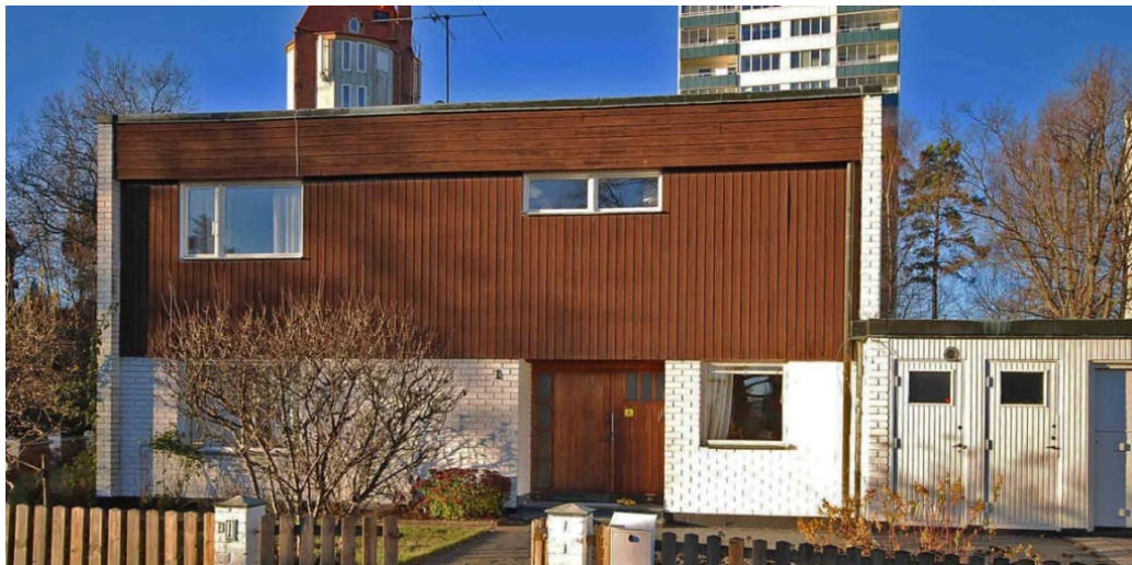
Arkitektfirma F. Jaenecke & S. Samuelsson ritade villor och kedjehus i kvarteret Misteln redan 1960 och som stod klara 1967. Exteriört är husen välbevarade sedan 1960-talet. (Misteln 1.)

Garage och förråd i en våning är vidbyggda ena kortsidan. Fasaden i stående panel är antingen vitmålad eller brunlaserad och trädörrarna är vitmålade. Kedjehuset på Misteln 14 och 4 är utformade som villorna, skillnaden är endast att garage/förrådslängorna är sammanbyggda och förenar husen.