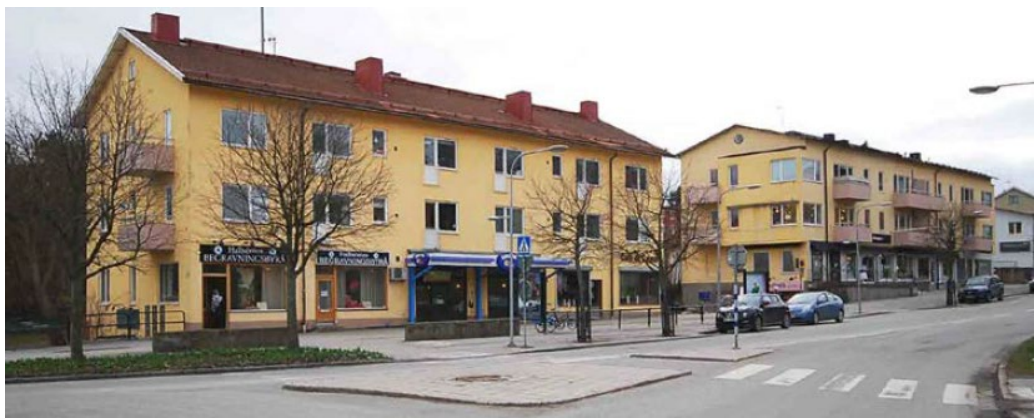
Kring Stockholmsvägen etablerades en centrummiljö under 1930-1950-talen.

Torsviks sydligaste del mot Stockholmsvägen präglades tidigt av den centrumbildning som uppstod i början av 1900-talet kring Torsvikstorg och Stockholmsvägen. I området uppfördes även Torsviks skola, vars äldsta byggnad är från 1906. Längs med Stockholmsvägen finns små bostads- och affärshus som enda återstoden av den centrummiljö som präglade Lidingö på 1930-1950-talen. I Torsvik finns även flera flerbostadshus som är utmärkta exempel på folkhemsbebyggelse från 1940-talets efterkrigstid, som på tex Siggebovägen och Skolvägen.