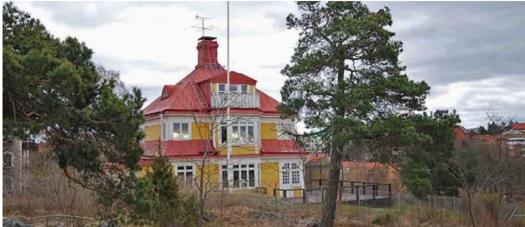
F.d. Ihrfeldtska barnhemmet, från ca 1900, en rest av sommarvillabebyggelsen på Torsviksbranten (Brofästet 6).

1943 års förslag till dispositionsplan för Lidingö resulterade i tillkomsten av stadens första moderna flerbostadsområde uppe på Torsvikshöjden, påbörjat 1943. Som en följd av stadsplanen bebyggdes samtliga kvarter närmast norr om Stockholmsvägen med flerbostadshus i tre-fyra våningar mellan 1944 och 1950. Det är den bebyggelse som i dag kännetecknar Torsvik och som sträcker sig längs Stockholmsvägens norrsida till Lidingö centrum.