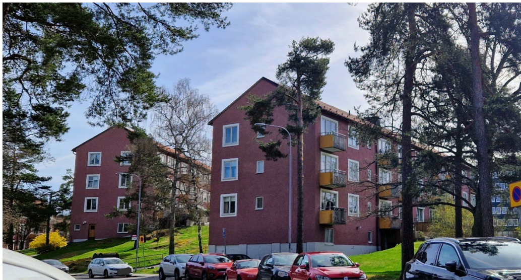
Kvarteren Torsdammen och Torselden. Lamellhusen från 1946–1947 är snedställda mot Torsvikssvängen vilket bidrar till att ge gaturummet i områdets sydöstra del en speciell karaktär.