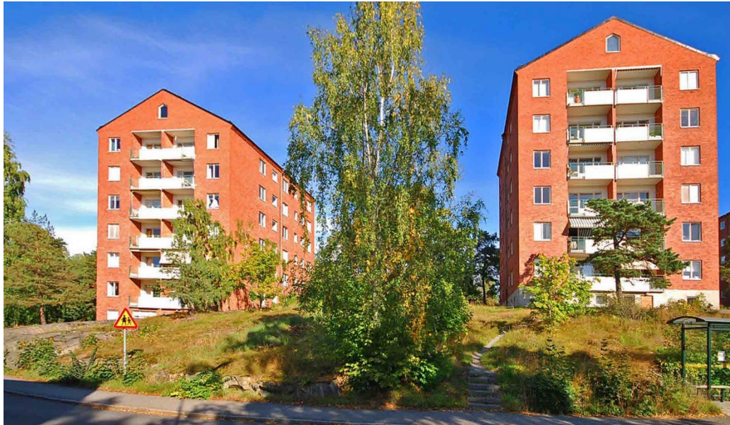
Torsborgen 3 och Torsklinten 1.

Bebyggelsen organiserades så att husen grupperades kring Torsvikssvängen, som från Torsplan längre ner i sluttningen löper i en båge upp och runt platån och ner igen. I det obebyggda området mellan husen anlades en central park, där skärgårdsterrängen och det lite karga platålandskapet togs till vara. Parken, med stora karaktärsträd, uppkallades efter trädgårdsarkitekten och författaren Ulla Molin. Skulpturer och en liten damm markerar parkens centrum.