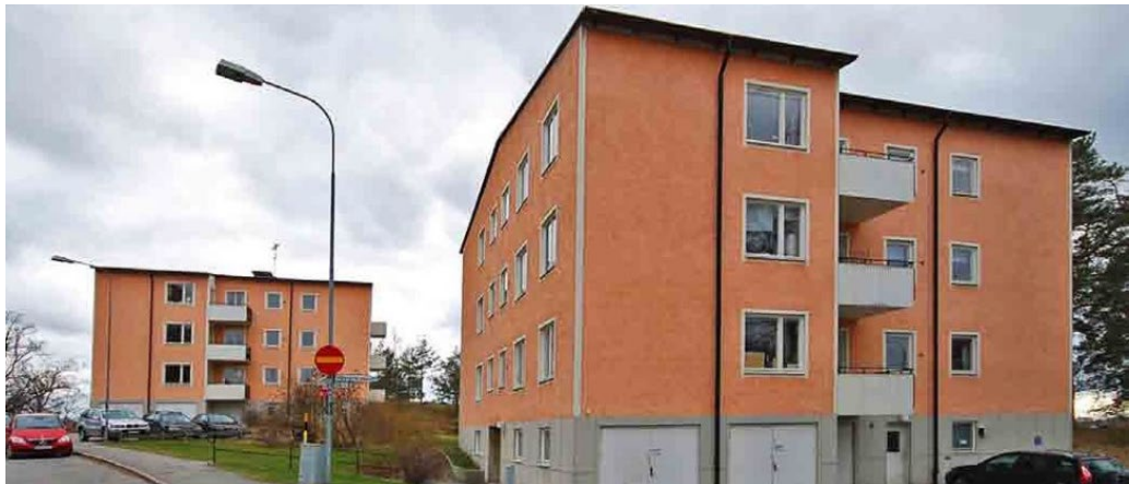
I kvarteret Torshallen högt upp i platåslutningen byggdes putsade låga punkthus 1946, ritade av Ancker, Gate & Lindegren.