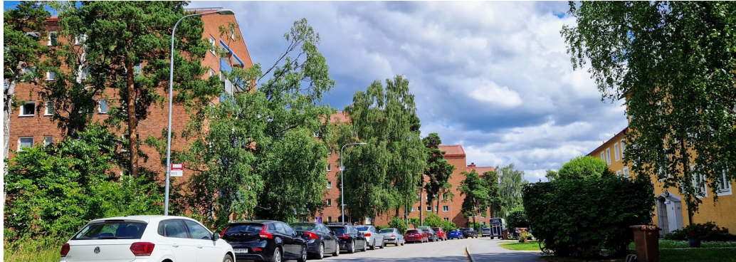
Punkthusen i kvarteret Torshammaren.

Arkitekterna bakom stadsplanen utformade även den stora merparten av bebyggelsen som främst uppfördes mellan 1944 och 1948. Enstaka hus slutfördes först i tidigt 1950-tal men i enlighet med 1940-talets intentioner. För att kunna bygga de 500 lägenheter som planerats valde man att bygga flera höga punkthus.