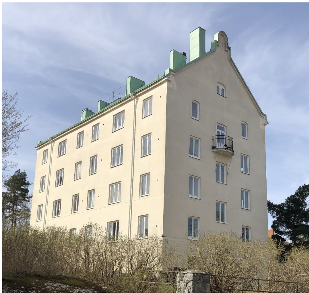
Västergötland 1 är ett av Lidingös äldsta kvarvarande flerbostadshus, uppfört 1913. 1910-talskaraktären är väl bibehållen och huset är mot den bakgrunden av mycket stort kulturhistoriskt värde.