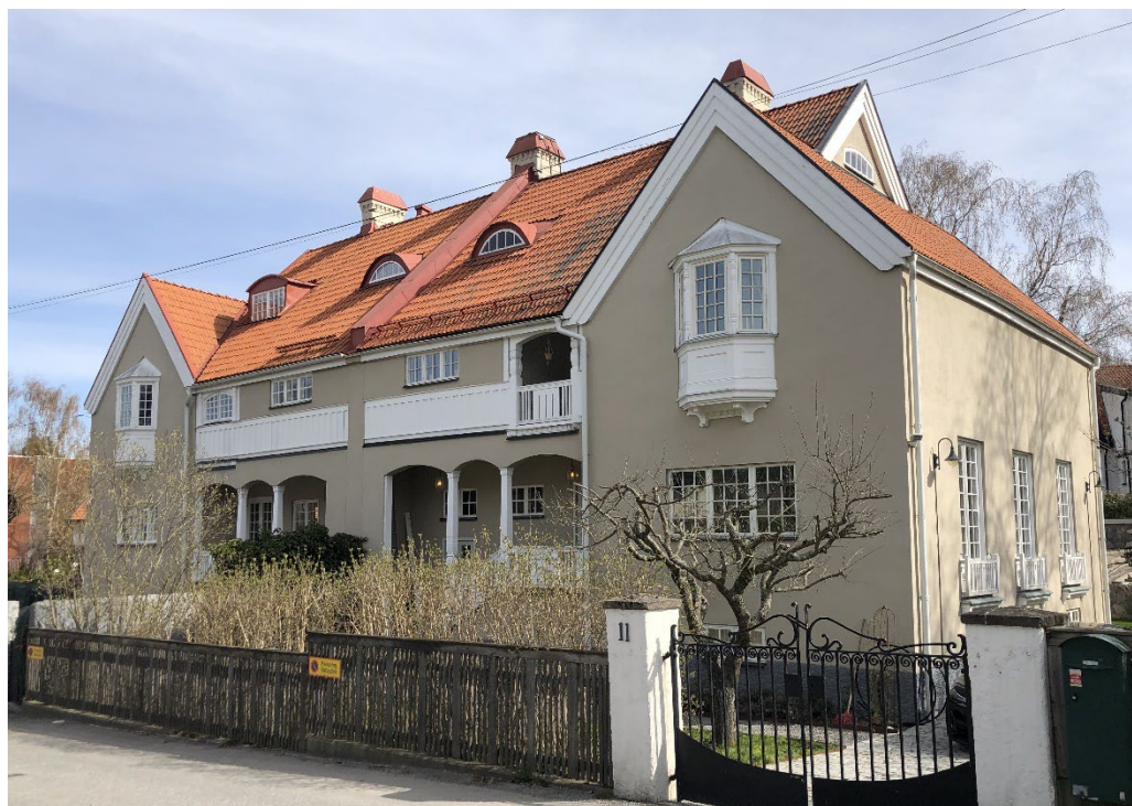
Dalarne 10–11. Den enda parvilla som byggdes i den nya villastaden omfattar ett långsträckt stort bostadshus och två flankerande lägre flyglar uppförda 1910.

Knuten till den ljusa putsarkitekturen men ensam i villastaden om att vara helt präglad av 1920-talets sparsmakade klassicism är Hälsingland 6 från 1922. Mer funkisbetonade villor från 1930–1940-talet har ljusa släta putsfasader, två- och treluftsfnster under sadeltak eller tälttak. Ett bra exempel på detta är Medelpad 5 från 1942.