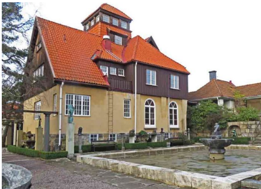
Den monumentala villan från 1908 är kärnan i Millesgårdens anläggning.