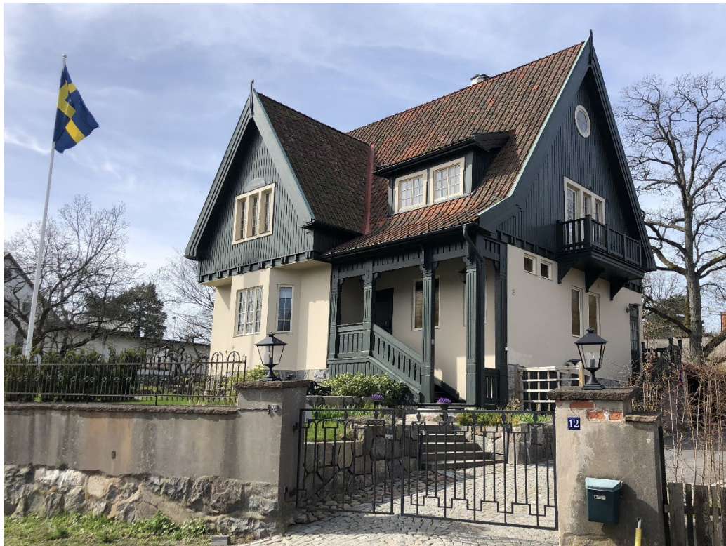
Hälsingland 5 från 1910, arkitekt Nils Persson.

Små burspråk, balkonger med enkla men dekorativa träräcken (ibland indragna balkonger) samt plåtavtäckta spröjsade nätta takkupor präglar många 1910-talsvillor oavsett utformning. Generellt är tätspröjsade fönster det vanliga i 1900-1910-talsbebyggelsen i Herseruds villastad. Öppna förstukvistar präglar flera entréer.