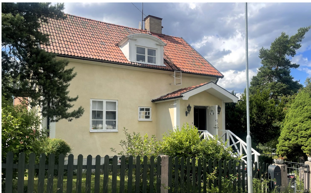
Lappland norra 1 är ritad av Einar Rudskog 1933 och bär stark karaktär av 1920-talets lätt klassicistiska villaideal. Slätputsade hörnlisener, profilerad taklist och takkupa och regelbundet placerade spröjsade fönster i liv med fasaden sätter prägel på exteriören.