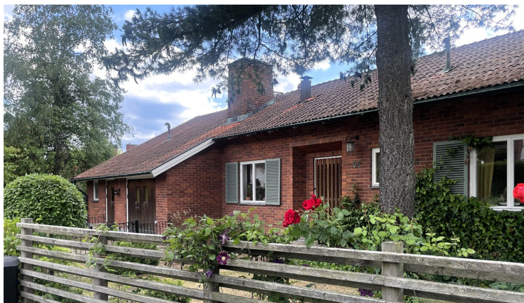
Villan på Södermanland 46 ritad av Gustaf Lettström 1953 och har en utformning med indragna och utskjutande volymer som skapar fina rumsligheter.

En annan karaktär har gatans norra sida med större tvåvåningsvillor, inklusive en stor parvilla, i högt och exponerat läge på tomterna Lappland västra 18–21. Den exklusiva men modest utformade villakarakteren är här mycket påtaglig. Här finns både röda och gula tegelvillor med vällagda murverk, tvåluftsfönster samt inslag av större fönstergrupper, indragna entréer och balkonger med tidstypisk 1950-talsutformning, koppartäckta små takkupor och sadeltak klädda med främst tegel. Inte minst är de välbevarade entrépartierna karaktäristiska inslag. I huvudsak har villorna en hög grad av ursprunglighet kvar.