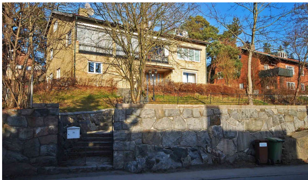
Lappland västra 19 av Arvid Klosterborg ritad 1953 till vänster. Till höger ligger Lappland västra 18 från 1952 ritad av Arthur Bleke.

av Herseruds främsta exempel på tidiga 1950-talsvillor. Den stora parvillan i gult tegel från 1951 på Lappland västra 20–21 är också ett fint exempel på det tidiga 1950-talets villaarkitektur. Parvillan ritades av Arvid Klosterborg. Samma arkitekt var verksam även med grannvillan på Lappland västra 19, uppförd 1953. Den gula tegelvillan bevarar i mångt och mycket en tidstypisk 1950-talsexteriör.