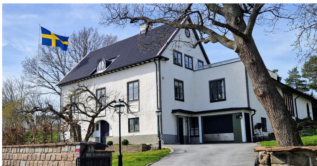
Hälsingland 6 ritad 1922 av Arvid klosterborg, tillbyggnad från 1933 av samma arkitekt.

Knuten till den ljusa putsarkitekturen men ensam i villastaden om att vara helt präglad av 1920-talets sparsmakade klassicism är Hälsingland 6 från 1922. Mer funkisbetonade villor från 1930–1940-talet har ljusa släta putsfasader, två- och treluftsfnster under sadeltak eller tälttak. Ett bra exempel på detta är Medelpad 5 från 1942.