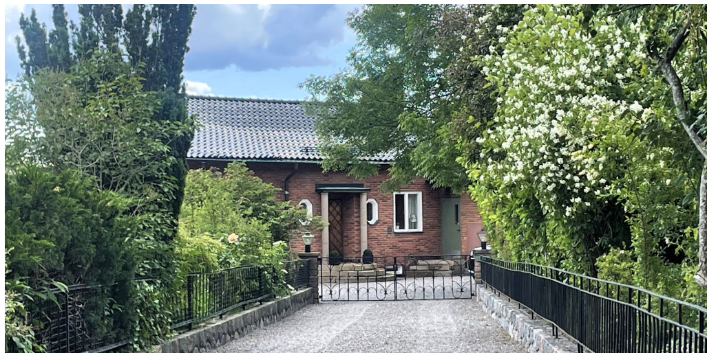
Södermanland 19 ritades 1950 av arkitekt Arvid Klosterborg med fasader i kraftfullt tegel och svängda takfall. Den eleganta entrén inramas av pelare.