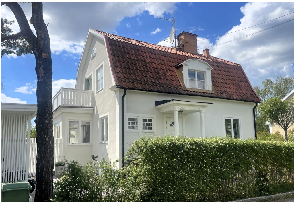
Lappland norra 5 är också ritad av Einar Rudskog men från 1932. Det lätta entrétaket buret på pelare med profilerat listverk ger byggnaden karaktär.