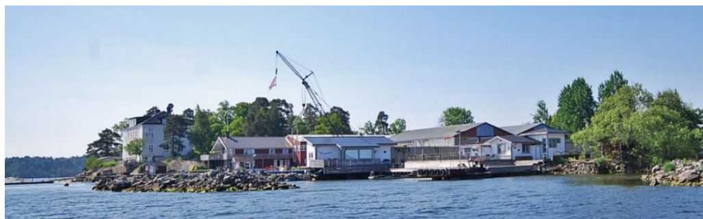
Duvholmen. Vy mot Duvholmens varv och den stora vita sommarvillan från 1890-talet.

På Storholmen fanns ett dagsverkstorp under Frösviks säteri från 1780-talet och framåt. I övrigt var det Stora Fjäderholmen och Stora Höggarn som hade en fast bosättning.