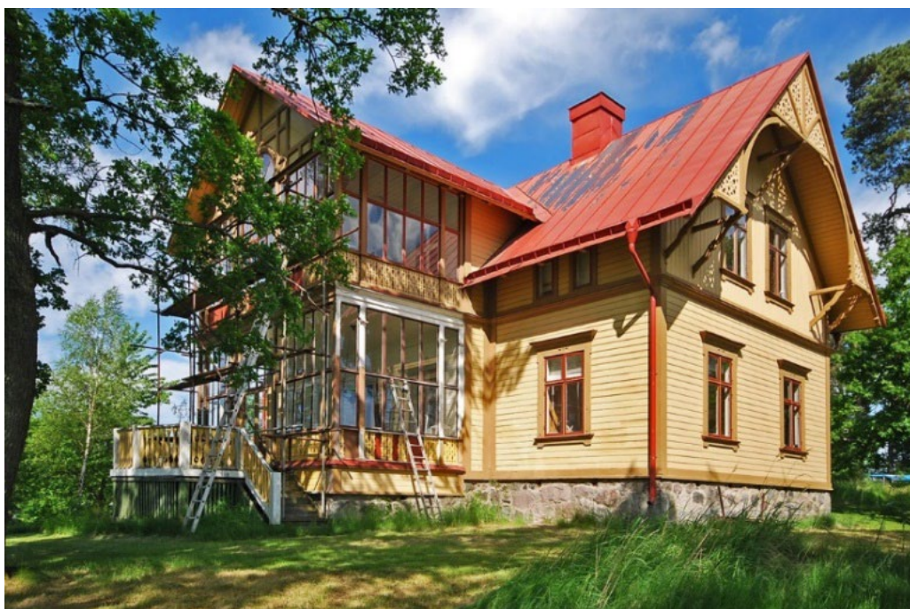
Lidingö 6:74 Schweizervillan.

Stenvillan vid varvet (Lidingö 6:129) uppfördes som sommarvilla troligen på 1890-talet och inreddes med fyra lägenheter. Villan är uppförd i tegel i två våningar med vind med vita kalkslammade fasader under ett lätt svängt sadeltak med svart ståndfalsad skivplåt. Det omsorgsfullt utformade entrépartiet med öppen veranda och glasade spröjsade dörrar är också ursprungligt. På senare år har flera fönster och sjösidans stora dubbla glasverandor blivit utbytta mot nyare fönstertyper. I övrigt är exteriören välbevarad. Interiören är välbevarad från 1890-talet inklusive planlösning, fyllningsdörrar, snickerier, stuckmedaljonger, polykroma kakelugnar och takmålningar. Den imponerande villan har ett monumentalt läge vid sjön nära