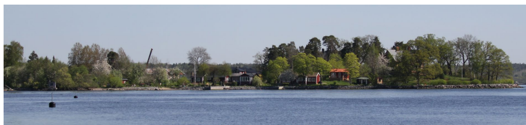
Duvholmen sett från Elfvik.

Duvholmen finns markerat på Lidingökartan från 1660-talet. Likt större delen av nordöstra Lidingön löd Duvholmen under Elfviks gård. På 1880-talet försålde Duvholmen vilket kom att medföra att flera sommarnöjen uppfördes på ön under 1890-talet. I början av 1900-talet etablerades Duvholmens båtvarv som fortfarande är verksamt. De stora bryggorna vid Schweizervillan och vid Stenvillan bör ha tillkommit 1900–1920. Tennisbanan anlades på 1920-talet. Enstaka små fritidshus tillkom under efterkrigstiden. I dag finns flera bofasta hushåll på ön. Någon reguljär båtförbindelse till Elfviklandet finns dock inte.