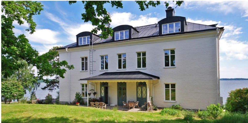
Den stora vita Stenvillan vid varvet. Entréfasad.

varvet, med murade terrasser och en stor gjuten betongbrygga från 1900-talets början nedanför.