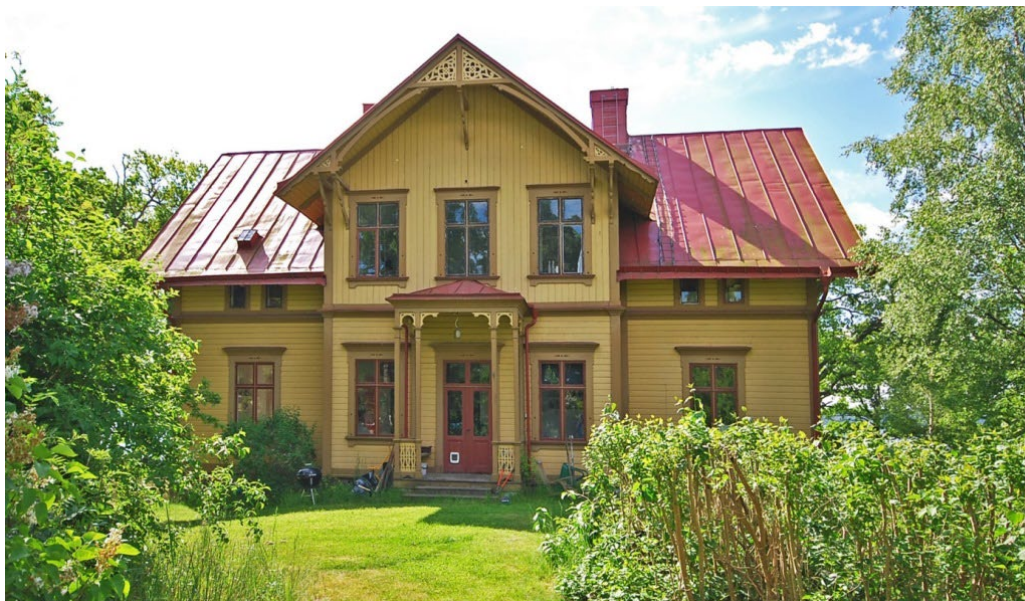
Lidingö 6:74 Schweizervillan.