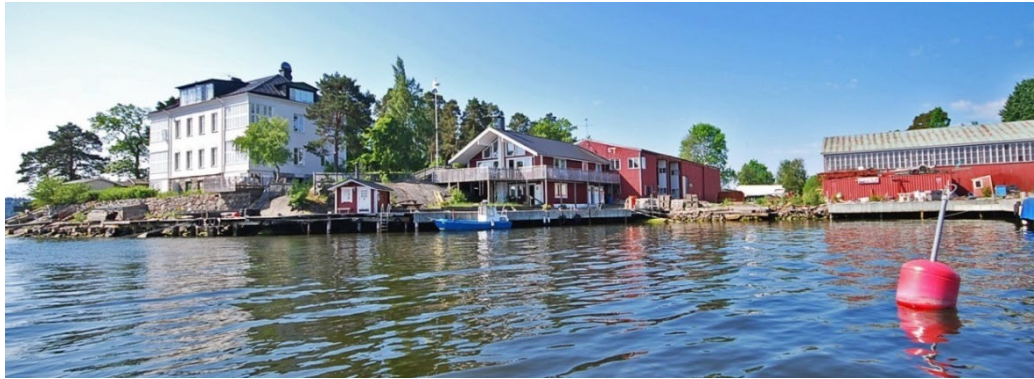
Duvholmens varv och Lidingö 6:129 med Stenvillan från 1890-talet.

Vid den centrala stigen inne på ön står ett mycket välbevarat utedass från sent 1800-tal (Lidingö 6:71) som varit knutet till någon av sommarvillorna. Byggnaden har gulmålad liggande spåntad panel, grönmålade spröjsade fönster, dörrar och rikligt utsirade snickerier. Den täcks av ett tälttak med rödmålad ståndfalsad skivplåt samt en tidstypisk ventilationshuv. Dasset är en karaktäristisk nyttobyggnad som speglar en förfluten tid och är av stort kulturhistoriskt värde.