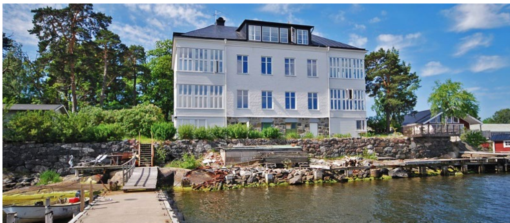
Stenvillan, fasad mot vattnet.