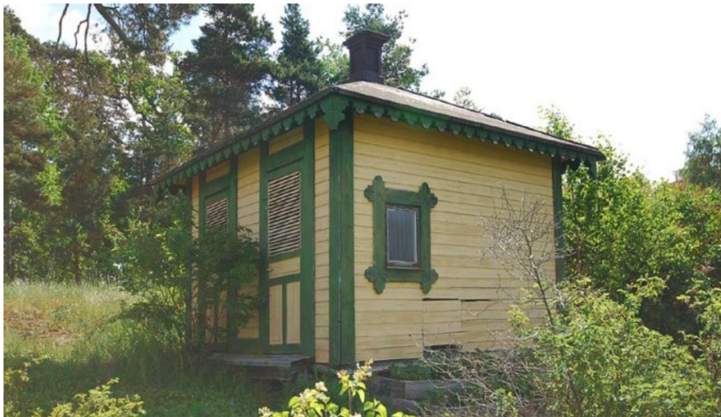
Lidingö 6:71. På ängen mitt inne på ön står detta välbevarade dass i tidstypisk panelarkitektur från sent 1800-tal.

Vid den centrala stigen inne på ön står ett mycket välbevarat utedass från sent 1800-tal (Lidingö 6:71) som varit knutet till någon av sommarvillorna. Byggnaden har gulmålad liggande spåntad panel, grönmålade spröjsade fönster, dörrar och rikligt utsirade snickerier. Den täcks av ett tälttak med rödmålad ståndfalsad skivplåt samt en tidstypisk ventilationshuv. Dasset är en karaktäristisk nyttobyggnad som speglar en förfluten tid och är av stort kulturhistoriskt värde.