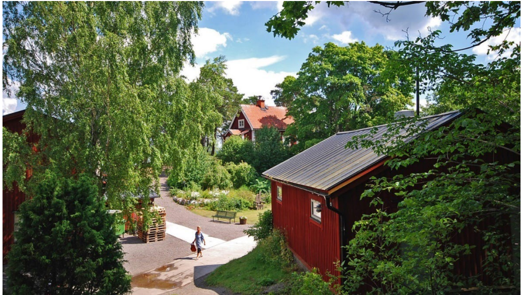
Norra delen, vy mot tillsynsmansbostaden Verkarns från 1922–1923. Vissa av försvarsindustrins byggnader har återanvänts, men mycket är nytt.