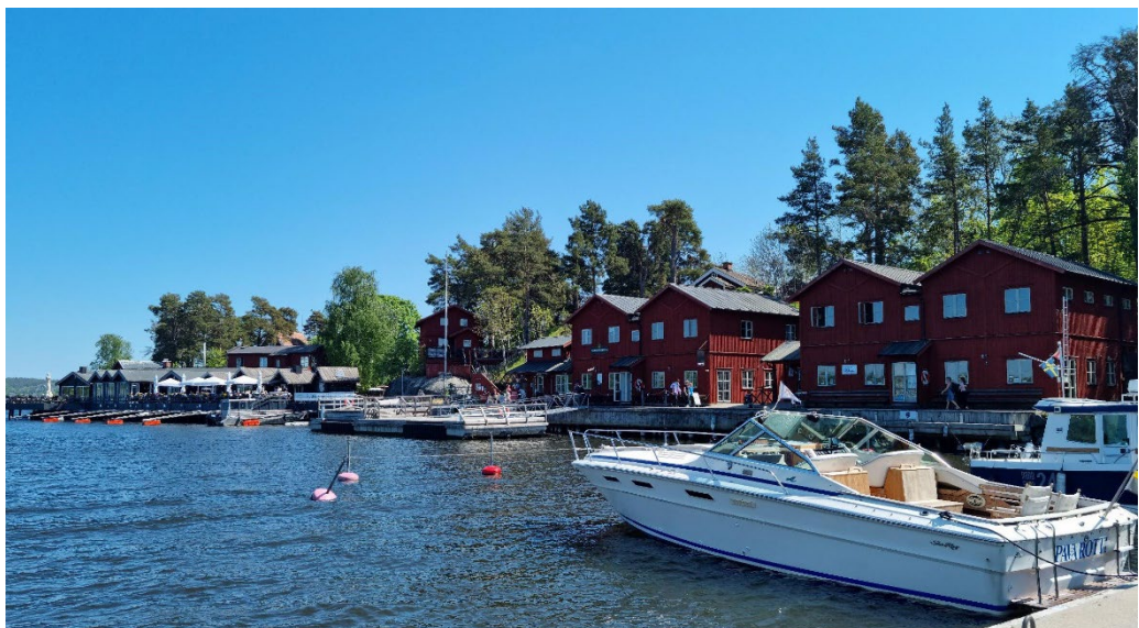
Vy från stora bryggan i norr mot dagens bryggeri och rökeri med flera verksamheter. Merparten av nu befintlig bebyggelse har tillkommit från 1985 fram till i dag.

Bland den yngre bebyggelsen i norr och nordost står här och var oftast mer eller mindre ombyggda faluröda små byggnader och längor med ursprung från försvarsindustrin. Exempelvis kan nämnas en liten byggnad numera båtclubbhus nära hamnen, en länga i nordost som lär ha inrymt administration samt byggnader vid allmogebåtmuseet.