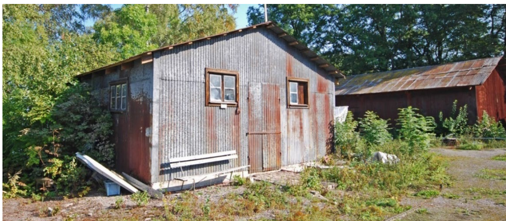
Ångsholmen. Minskjulet och Dimsyreskjulet hör samman med försvarsindustrins minhantering.

De försvars- och industrihistoriska miljöerna är också av mycket stort intresse. Försvarsbebyggelsen från 1920–1940-talet är numera i mångt och mycket en integrerad del av kulturmiljön på holmen. De försvarsrelaterade byggnader som finns kvar ligger alla i nord/nordost och hör samman med andra världskrigets minhantering. Generellt präglas de av en funktionell och saklig industriarkitektur, starkt nyttoinriktad men med tydliga och karaktäristiska drag. Regelkonstruktioner med självbärande tak samt fasad- och takbeklädnad av omålad korrugerad plåt av lite kraftfullare äldre typ kännetecknar Stora Paravanan och Minskjulet på nordkusten strax öster om det före detta Karantänsjukhuset.