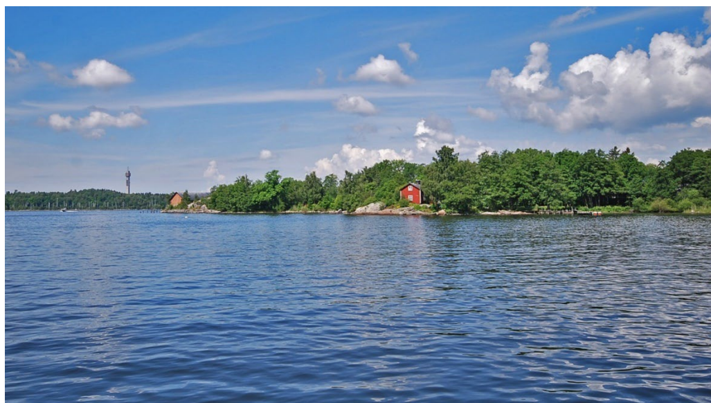
Vy mot Ängsholmen från söder med kolladan längst ut på udden i väster och rakt fram det f.d. karantänssjukhuset från 1890-talet.

Särpräglad är den betydligt kargare och från land lite otillgängliga miljön kring den stora Kolladan i nordväst. Kolladan har en äldre karaktär och utformning jämfört med försvarets bebyggelse. Troligen härstammar den från oljeupplagets tid i början av 1900-talet men kan ha "återanvänts" som kollada av försvaret. Den röda tegelbyggnaden är helt orienterad mot vattnet och ligger tätt mot bergväggen. Från land når man den genom att gå över klipporna. Byggnaden på udden med spår till den nerrasade bryggan har stora kultur- och upplevelsevärden även om den är stadd i förfall. I närheten står en bod i betong.