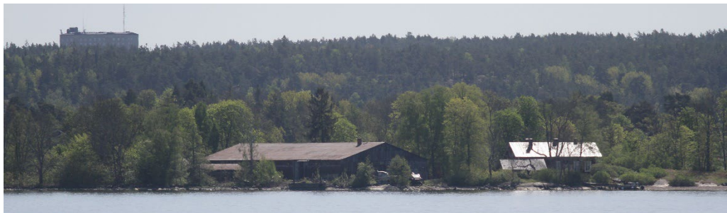
Ängsholmen från vattnet med stora Paravanen i förgrunden.

Holmens bryggor finns dels vid det före detta karantänssjukhuset i norr, dels vid Stora Paravanen som ligger strax intill. En större brygga för transport och inlastning fanns även vid Kolladan i väster, numera nedfallen.