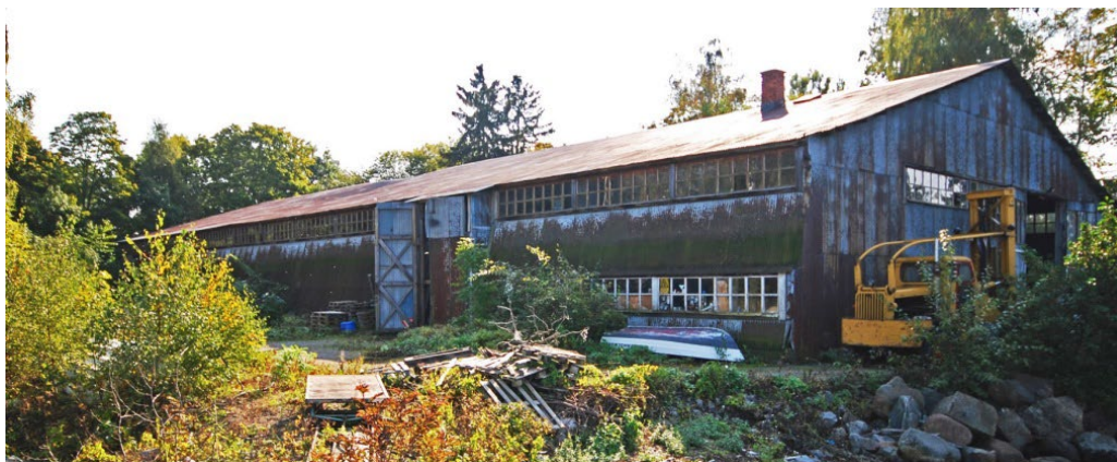
Stora Paravanskjulet från 1930-talet, som använts inom försvarets minhantering på ön, är genom sitt ursprung en kulturhistoriskt intressant industribyggnad.

Den monumentala långa Stora Paravanan har en mycket karaktärsfull utformning med sitt utsvängda nedre väggparti, gavelfasadens stora portar och de långsmala ljusinsläppen längs takfoten. Spår leder mellan byggnaderna och från Stora Paravanan ut på den stora gjutna bryggan.