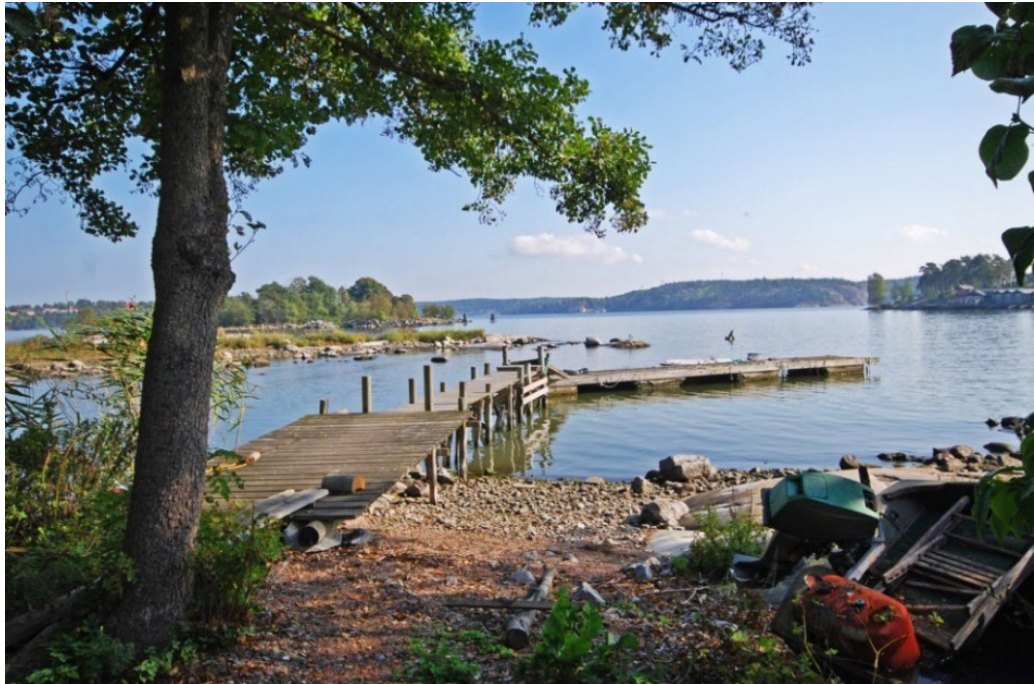
Bryggan vid det f.d. Karantänssjukhuset.

Latrinhanteringen pågick från 1849 fram till 1880-talets slut och upphörde till sist på grund av alla klagomål över stanken som låg tung över holmar och farled. Fjäderholmarna var länge förknippade med latrinhanteringen.