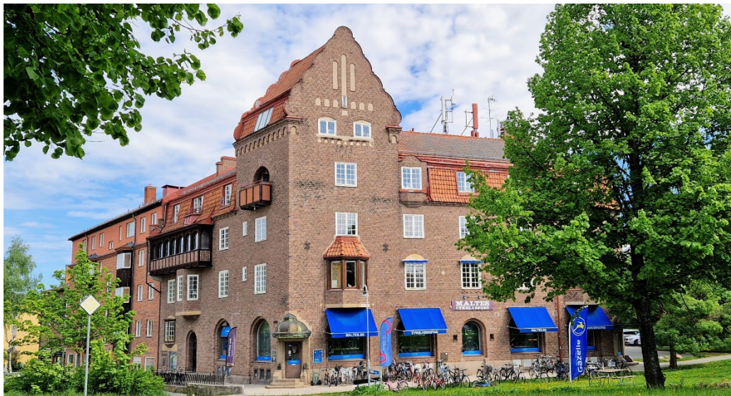
Vasa 1, Centralpalatset från 1913 är ritat av arkitekten Alf Landén (1876–1959).

Av den stadsmässiga centrumbebyggelsen med bostäder och affärslokaler som planerades av Per Olof Hallman under tidigt 1900-tal var det endast Centralpalatset och lite senare Vasaborgen som kom till utförande. Alf Landén var arkitekt till Centralpalatset 1913. Han skapade en nationalromantisk borgliknande centrumbyggnad i tegel. Centralpalatset har en tidstypiskt framhävd monumental placering i fonden av den tänkta centrumbildningen vid Lejonvägen /Vasavägen.