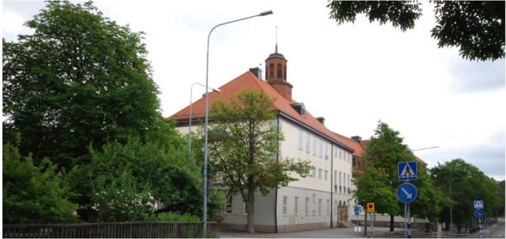
Hersby Gymnasium uppfördes mellan åren 1913–1918.