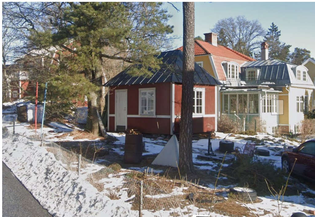
Bild av komplementbyggnaden på Vitmossan 8.