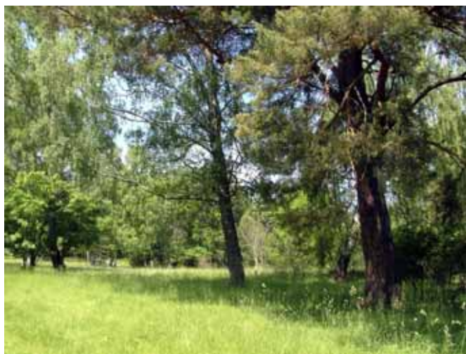
Hagmark vid Fiskarudden, område A

Naturtyp: Annan träd- och buskbärande hagmark, yta: 5,5 ha