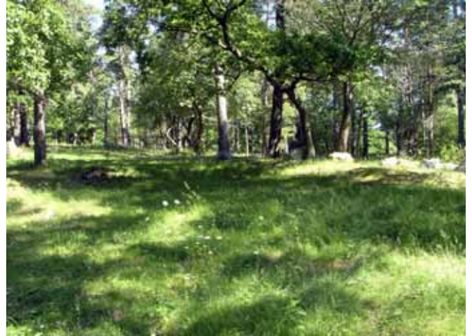
Betad skog, område C

Området utgörs av en höjd med blockrik morän beväxt med framför allt tall. Övriga träd är gran, asp, rönn, ek, oxel, lönn en och klarbär. Av de inventerade områdena är detta den enda lokalen där slätterfibbla ( Hypochoeris maculata ) påträffades. I området häckar ormvrak.