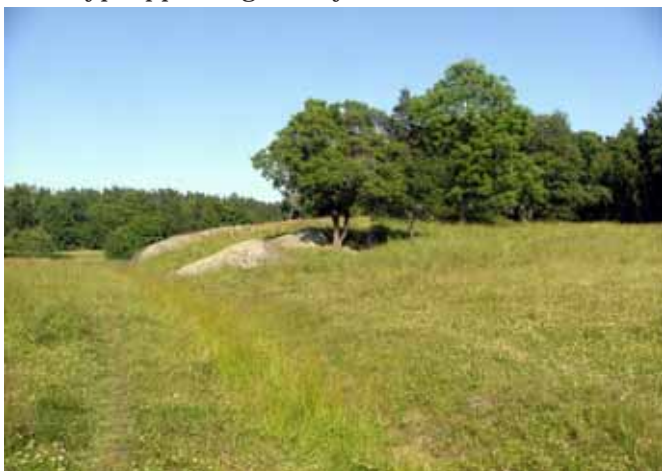
Öppen hagmark, område D.

Område D är starkt gödselpåverkat och främst beväxt med grova gräs som ängskavle, hundäxing, timotej och kvickrot samt majsmörblomma. De positiva signalarterna är funna i torra partier, i områdets västra del. Betande djur var vid inventeringstillfällena får och häst.