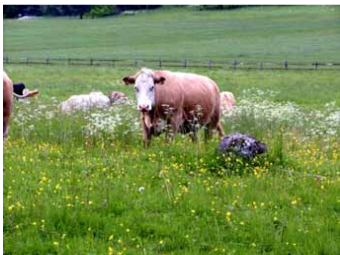
Betande kor från Elfviks gård ...

I likhet med ängen har naturbetesmarken inte utsatts för kultiverande åtgärder. Den ska inte ha gödslats, kalkats, stenröjts, dränerats, eller såtts in med vallväxter. Även här är det bristen på näring, framför allt kväve, och den traditionella hävden som ger den rikliga mångfalden. Målet är inte att få vinterfoder till djuren, utan på naturbetesmarken går djuren och betar så stor del av växtsäsongen som möjligt. Betesmarkerna ska ge så hög och uthållig avkastning som möjligt och det gäller att få en tät grässväl.