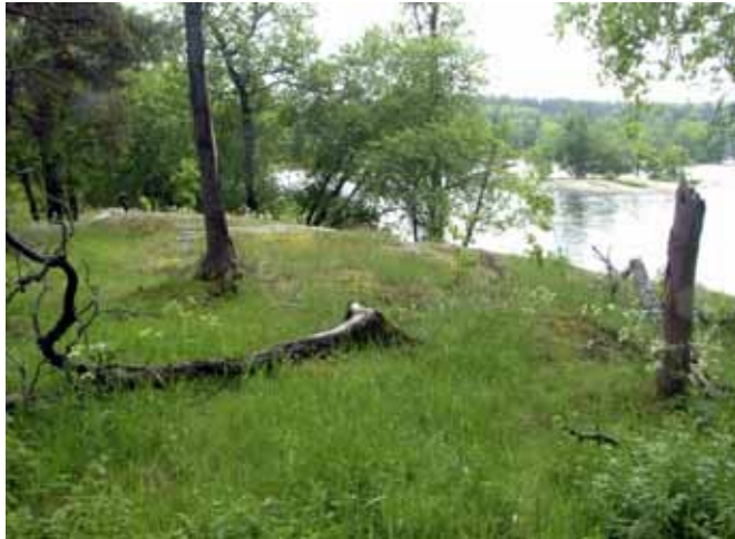
Hagmark vid Kyrkviken och Hustegafjärden, område B

Naturtyp: Öppen hagmark/ betad skog, yta: 3,5 ha