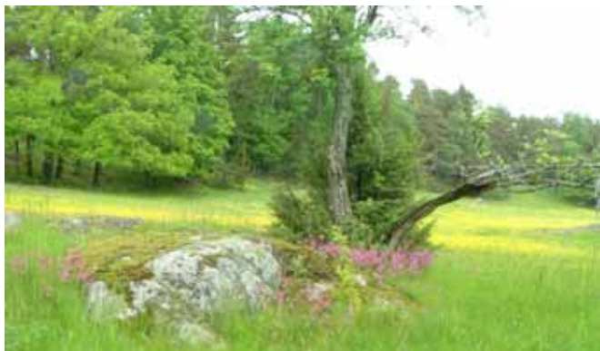
Åkerholme, område B