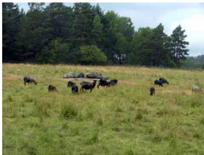
... och fårbete.

Den traditionella hävden i betesmarker är: