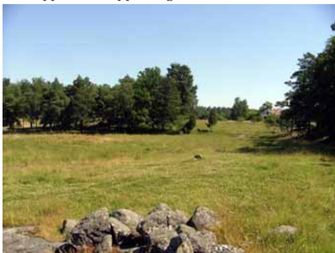
Öppen äng, Plåten, område E

Området består av dels mark som gödslats (åkermark), dels ogödslad mark med troligtvis en mycket lång hävdkontinuitet. Hela området betas av häst, får och nöt. Betestrycket är svagt. Det botaniskt värdefullaste