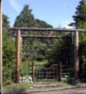
7. Cyrillus Johanssons trädgård.