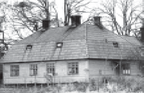
1. Bo gård före renoveringen.