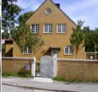
2. F d mejeriet Victoria på Grönstavägen.