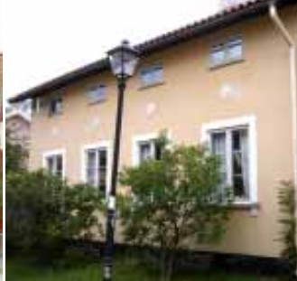
5. Bygge och Bo.