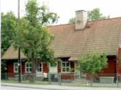
4. Lidingös första förskola.