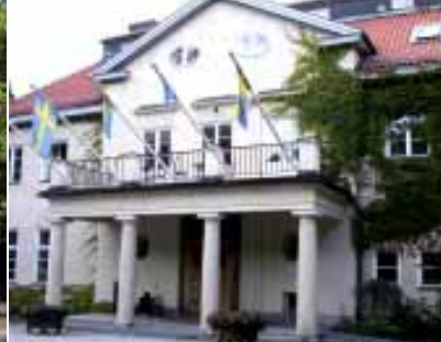
10. Paulsro (Mästarvillan).