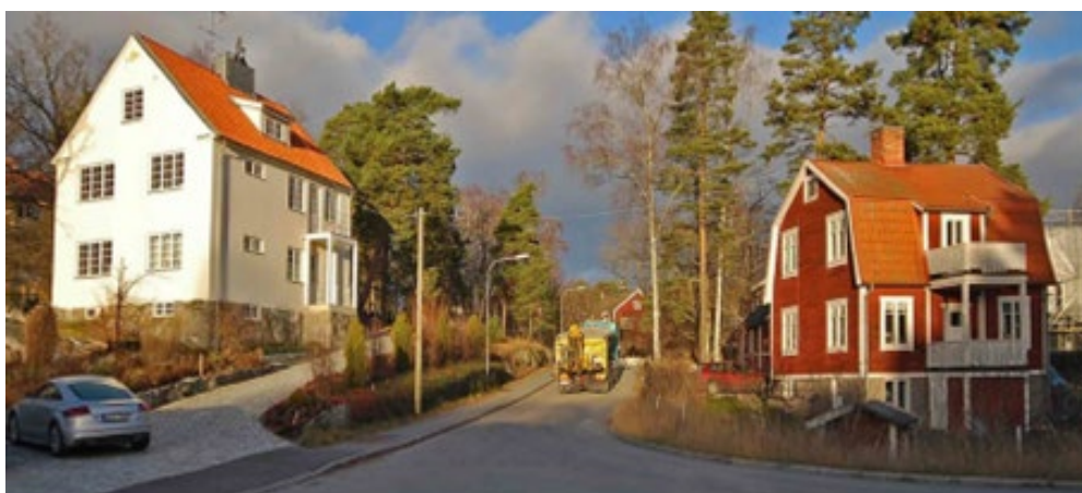
Bild över befintlig bebyggelse på Vitmossan 8 till höger i bild. Vy från Sveavägen. Byggnaden är centralt belägen i kulturmiljön och är viktig för upplevelsen av Bergsättraområdets kulturmiljövärden.

Tidstypiska kännetecken är bland annat fasadens faluröda spåntade panel, fönstren med tätspröjsade överdelar, vitt listverk, entré med överbyggd förstukvist och tegeltäckt brutet tak. En naturpräglad villatomt med en stor ek, björkar och tallar samt ett falurött uthus inramar bostadshuset. Byggnaden med dess ursprungliga utformning är även av mycket stor betydelse för upplevelsen av den större kulturmiljön i Bergsättra. Byggnaden är utpekad som kulturhistoriskt värdefull i äldre inventering av Lidingös byggnader (1971–1986) och i en inventering som gjorts av Lidingös byggnader under 2013–2015. Mot den bakgrunden bedöms byggnaden som särskilt kulturhistoriskt värdefull.