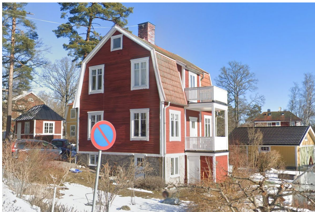
Bild över befintlig bebyggelse på Vitmossan 8. Vy från Bergsättravägen.