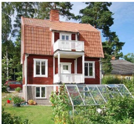
Huvudbyggnaden på fastigheten Vitmossan 8.