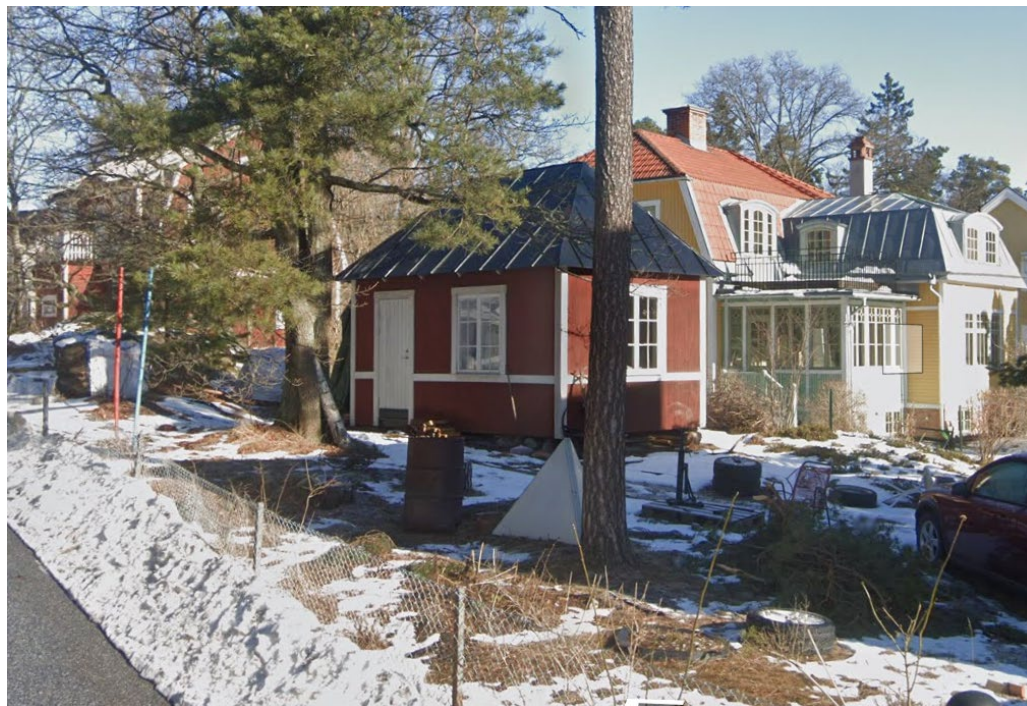
Bild av komplementbyggnaden på Vitmossan 8.