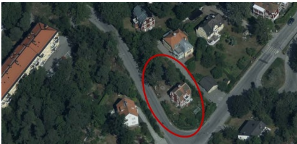
Flygfoto över området som visar fastigheten Vitmossan 8 och omkringliggande bebyggelse. Planområdet är markerat med röd oval.

I kvarteret Vitmossan ligger flera villor med prägel av 1910-talets landsbygdsromantiska strömningar och de utgör en särskild husgrupp inom den större kulturmiljön. Husen karaktäriseras av faluröd liggande eller stående panel, vita tätspröjsade fönster, vita snickerier samt glasade eller öppna verandor och tegeltäckta brutna tak. Några av husen är lite större och inrymde bostäder för ett par familjer. Ofta står ett falurött uthus på den omgivande tomten. Flertalet bostadshus har renoverats och genomgått en del utvändiga förändringar i senare tid. Helhetsintrycket av 1910-tal är dock fortfarande tydligt.