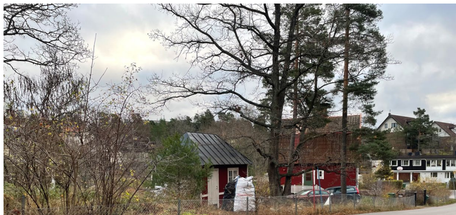
På bilden syns de två värdefulla tallarna och eken.

Planområdet är inte utpekade som ett särskilt värdeområde i stadens grönsplan. Planområdet gränsar dock till en ekologisk korridor för ädellövskog. Inga intresseområden vad gäller flora, fauna eller rödlistade arter finns registrerade inom planområdet. Området ligger inte inom något ekologiskt särskilt känsligt område (ESKO).